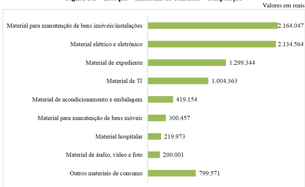
Figura 3.1 – Estoque – materiais de consumo – composição

Os itens mais relevantes são os relacionados a material para manutenção de bens imóveis/instalações ( 25,34% ), material elétrico e eletrônico ( 24,99% ), material de expediente ( 15,21% ) e material de TI ( 11,76% ), conforme se observa na figura abaixo: