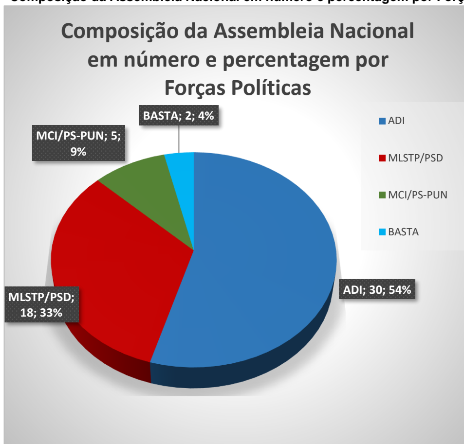
Gráfico 1 – Composição da Assembleia Nacional em número e percentagem por Forças Políticas