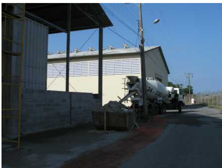
2 - 07/06/2006 - Construção de almoxarifados