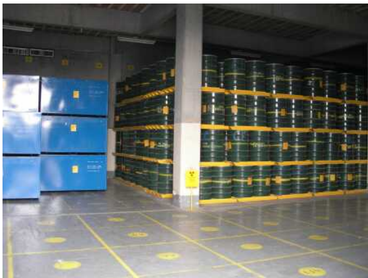
1 - 07/06/2006 - Depósito de Rejeitos