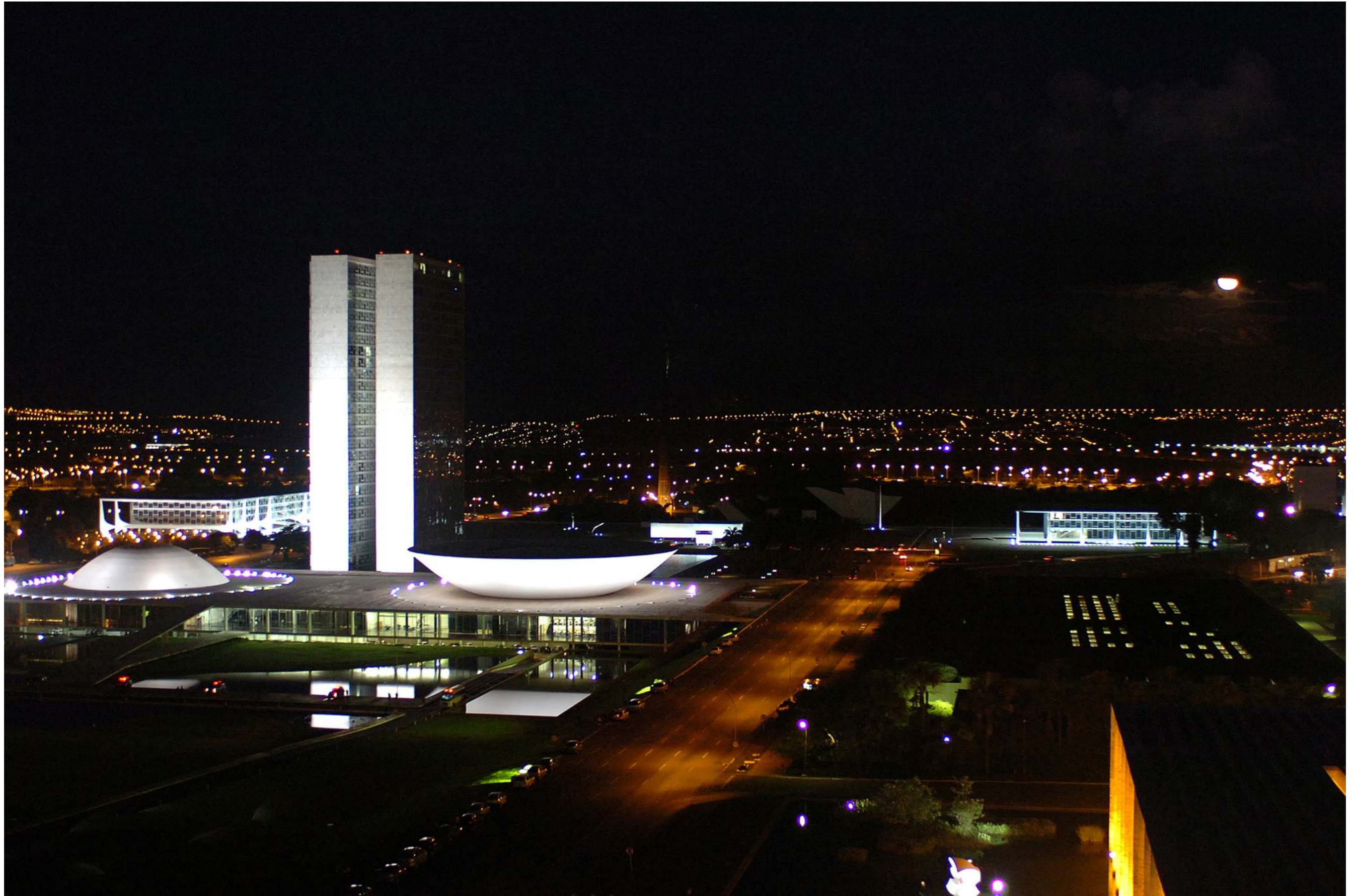
Congresso Nacional - Praça dos Três Poderes - Palace of the National Congress