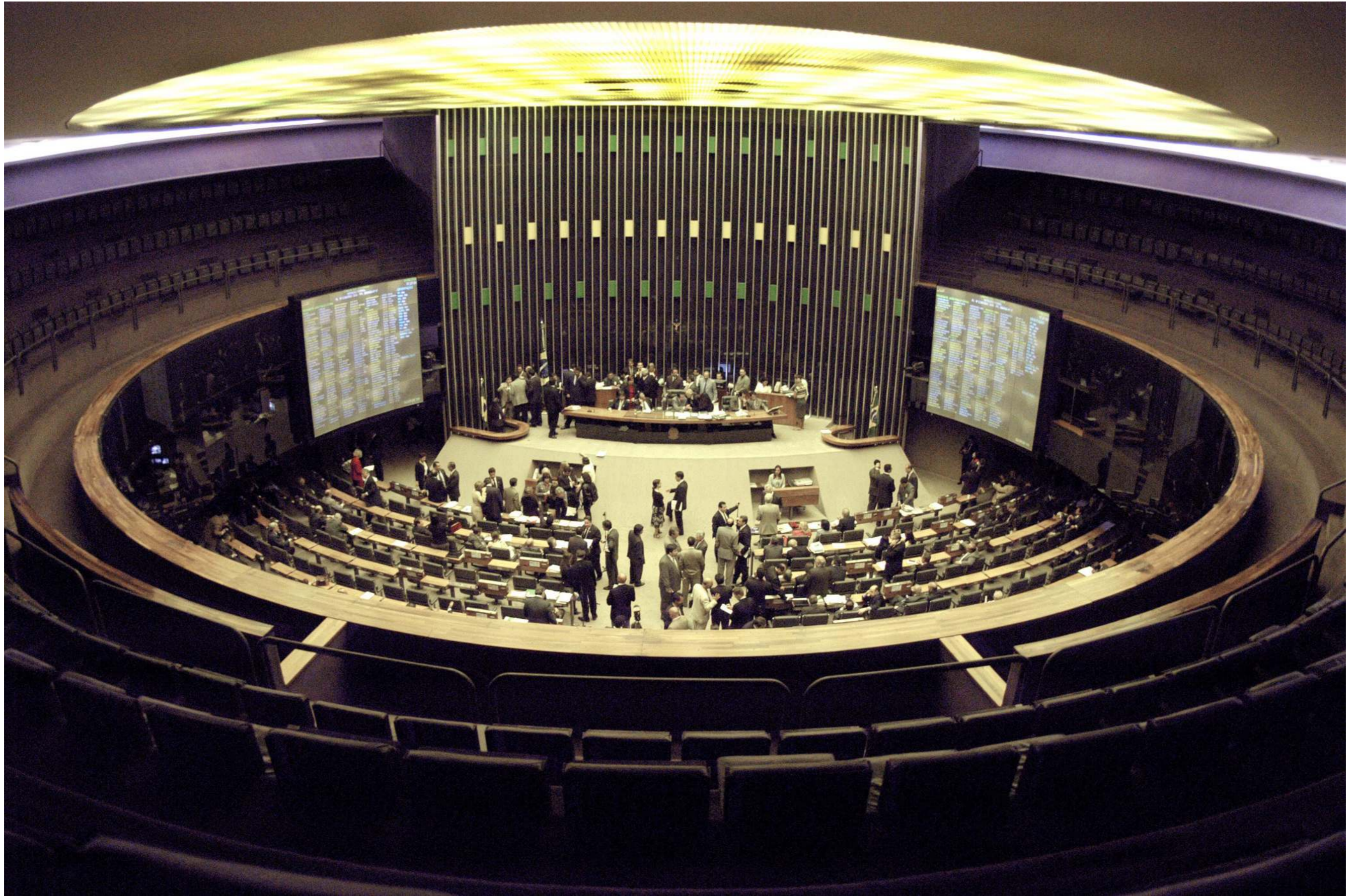
Câmara dos Deputados - Plenário Ulisses Guimarães - Palace of the National Congress