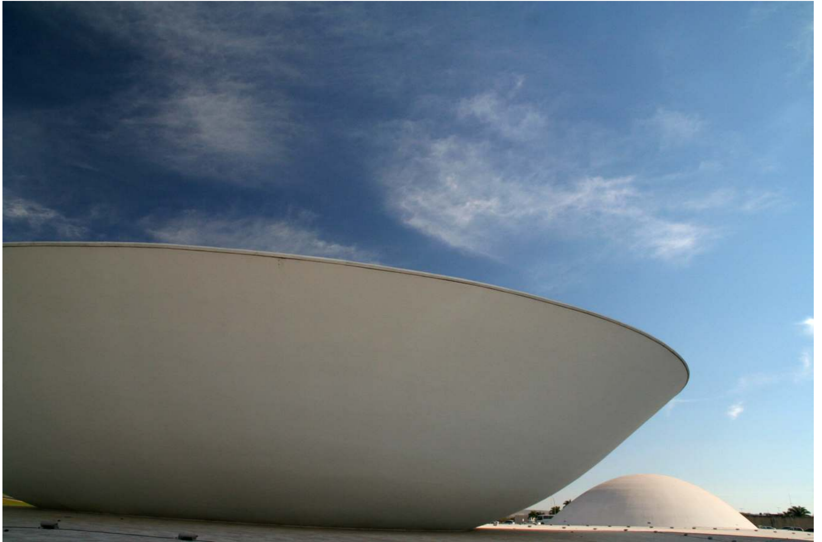
Congresso Nacional - Palace of the National Congress