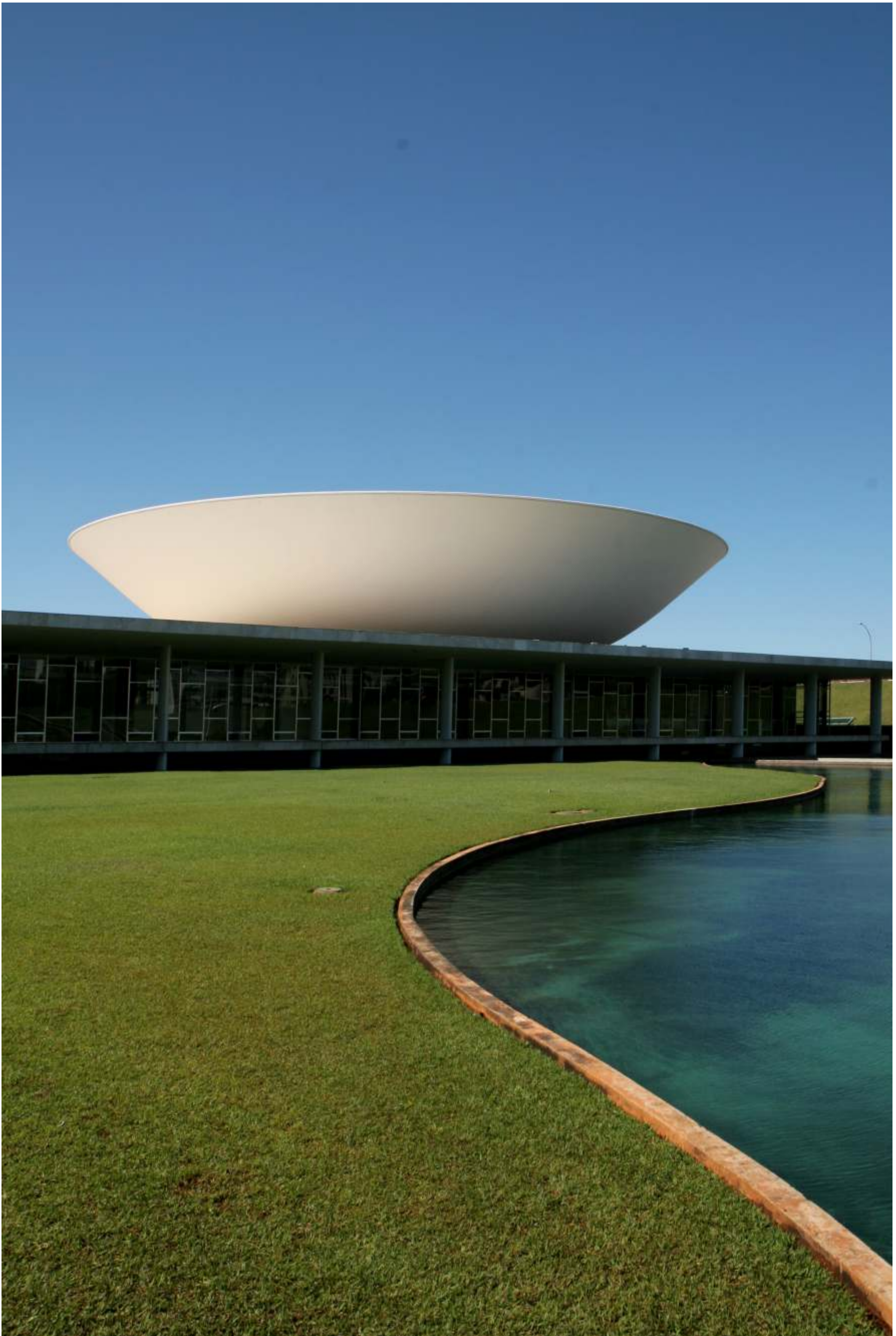
Câmara dos Deputados - Palace of the National Congress