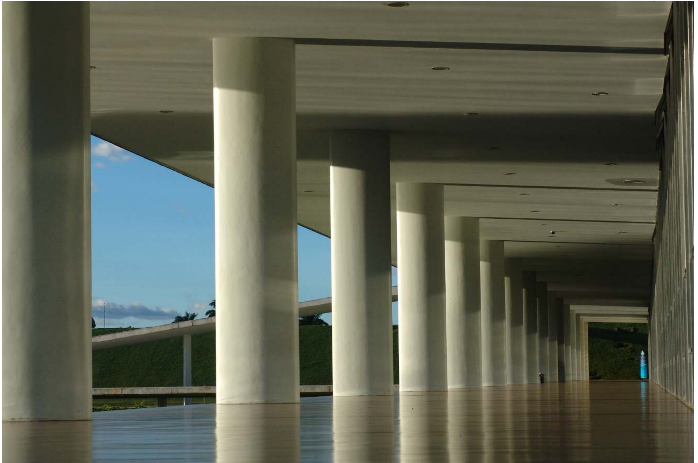
Congresso Nacional - Palace of the National Congress