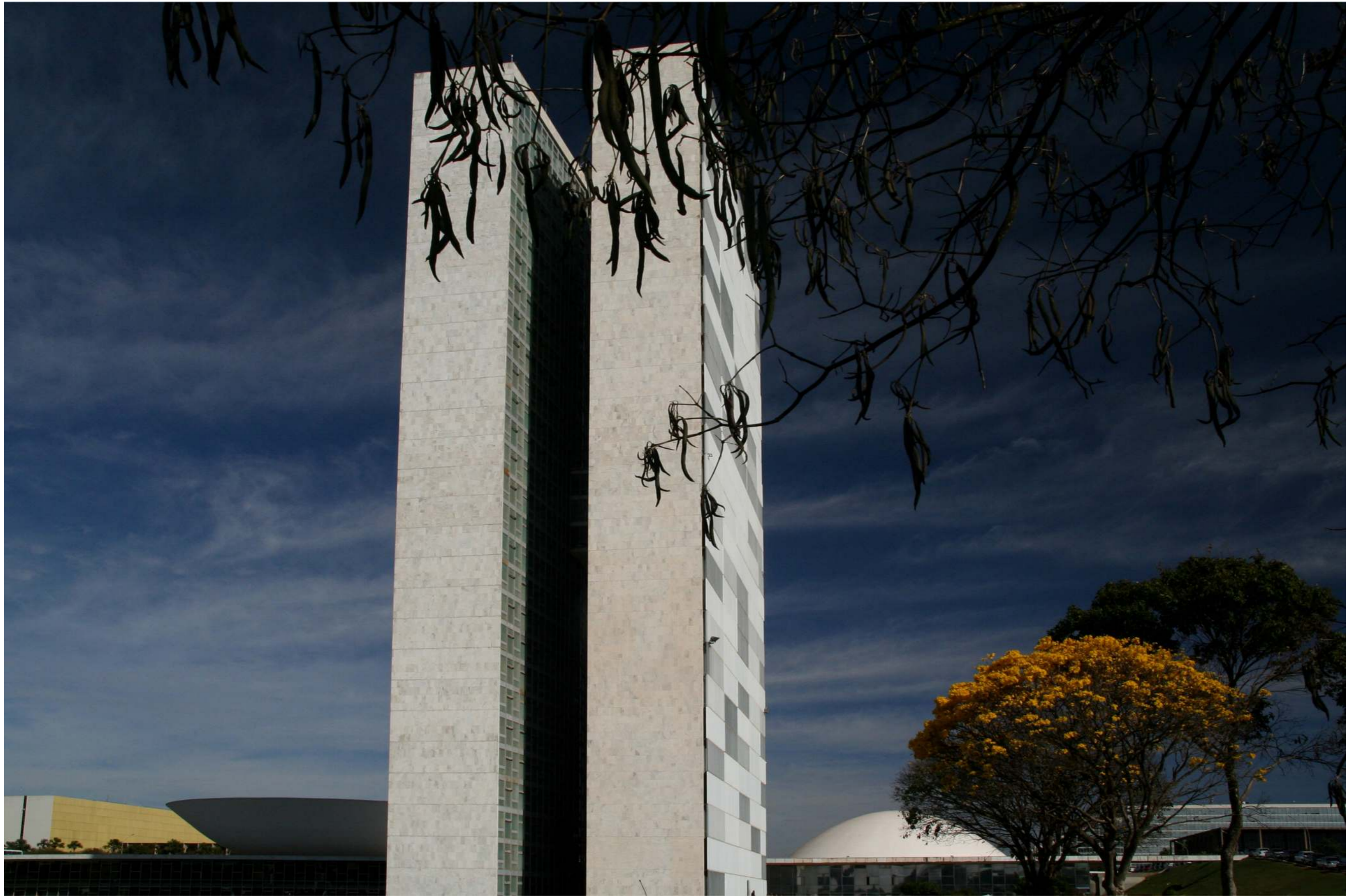
Congresso Nacional - Palace of the National Congress