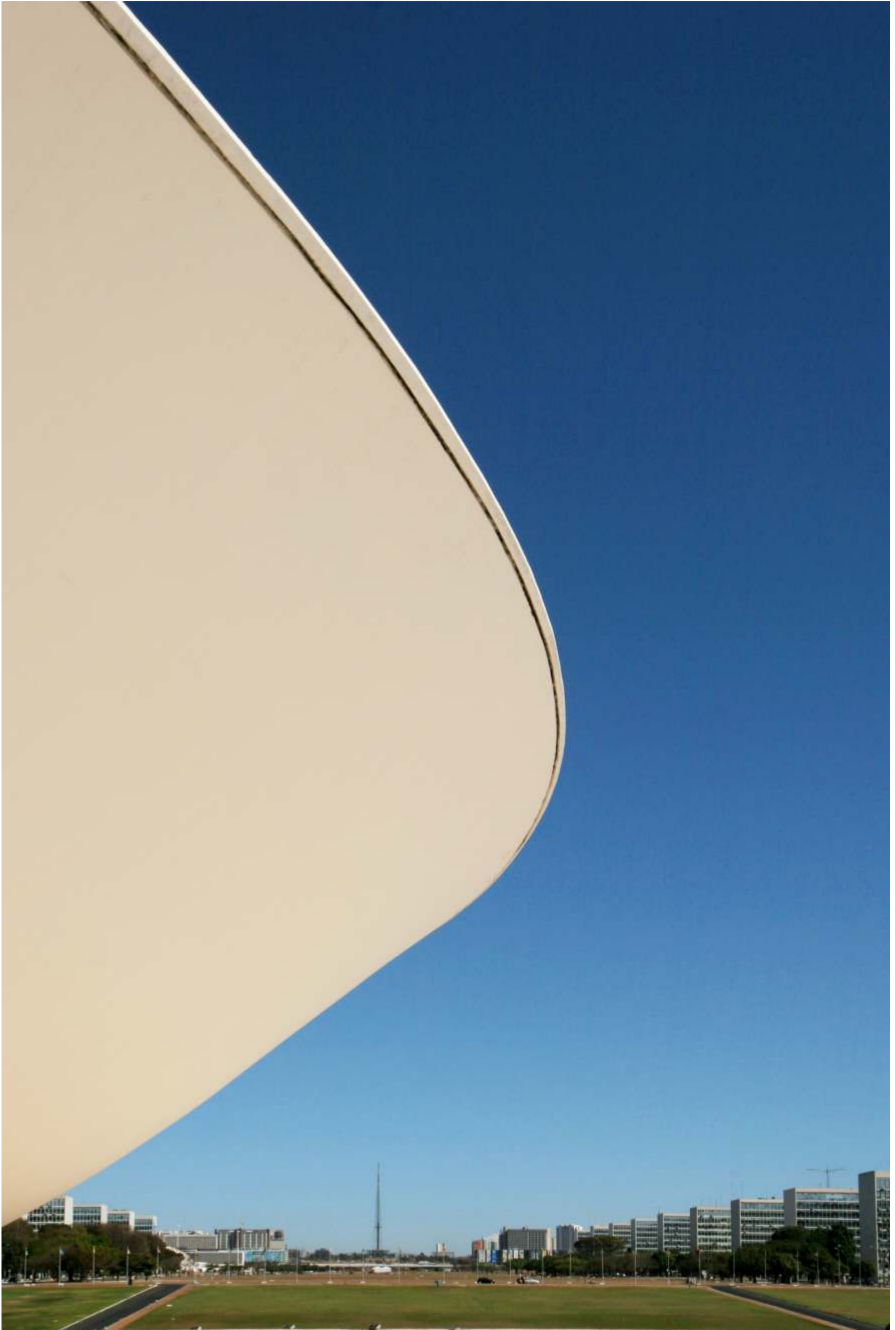
Câmara dos Deputados - Palace of the National Congress