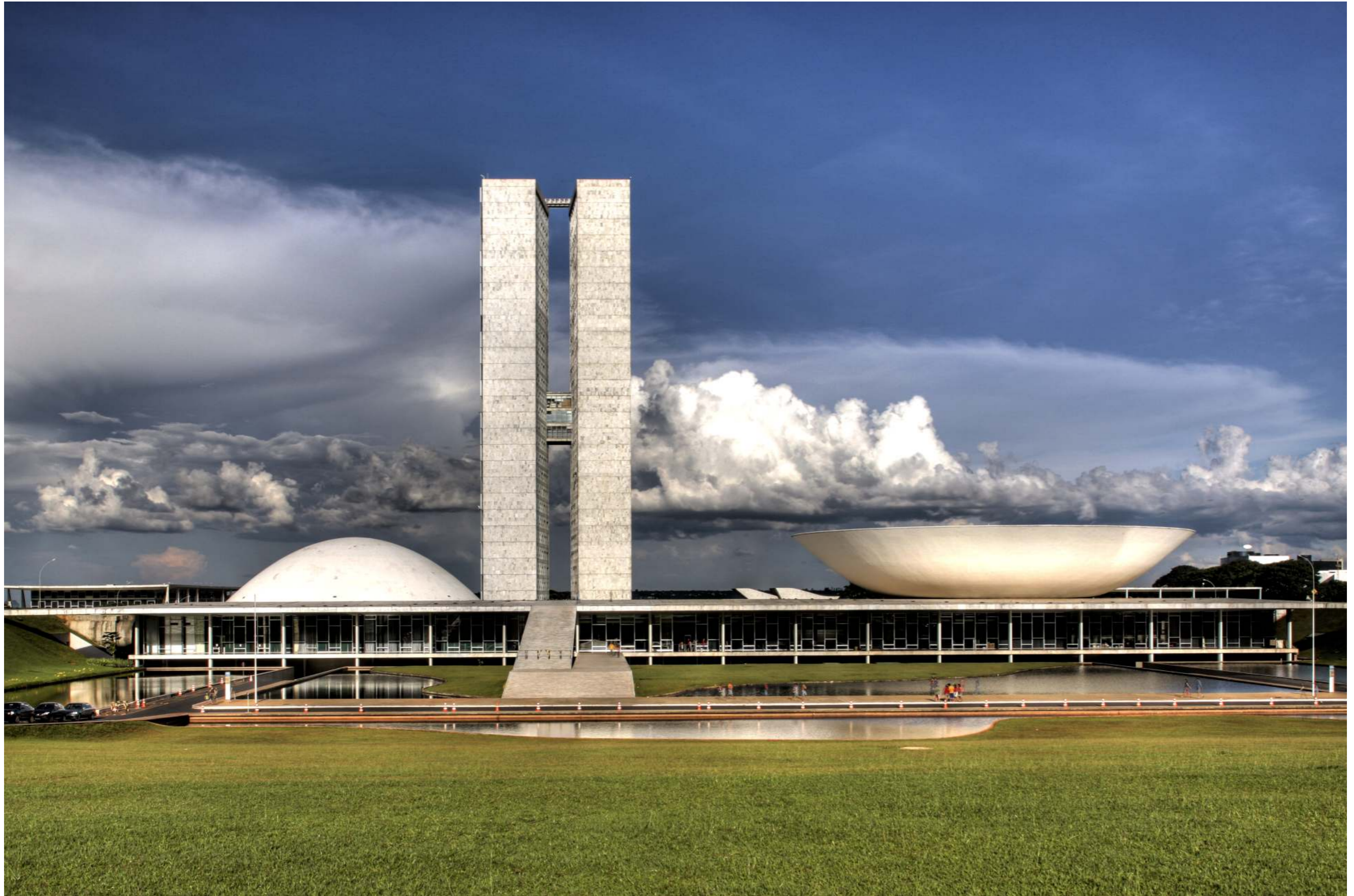
Congresso Nacional - Palace of the National Congress