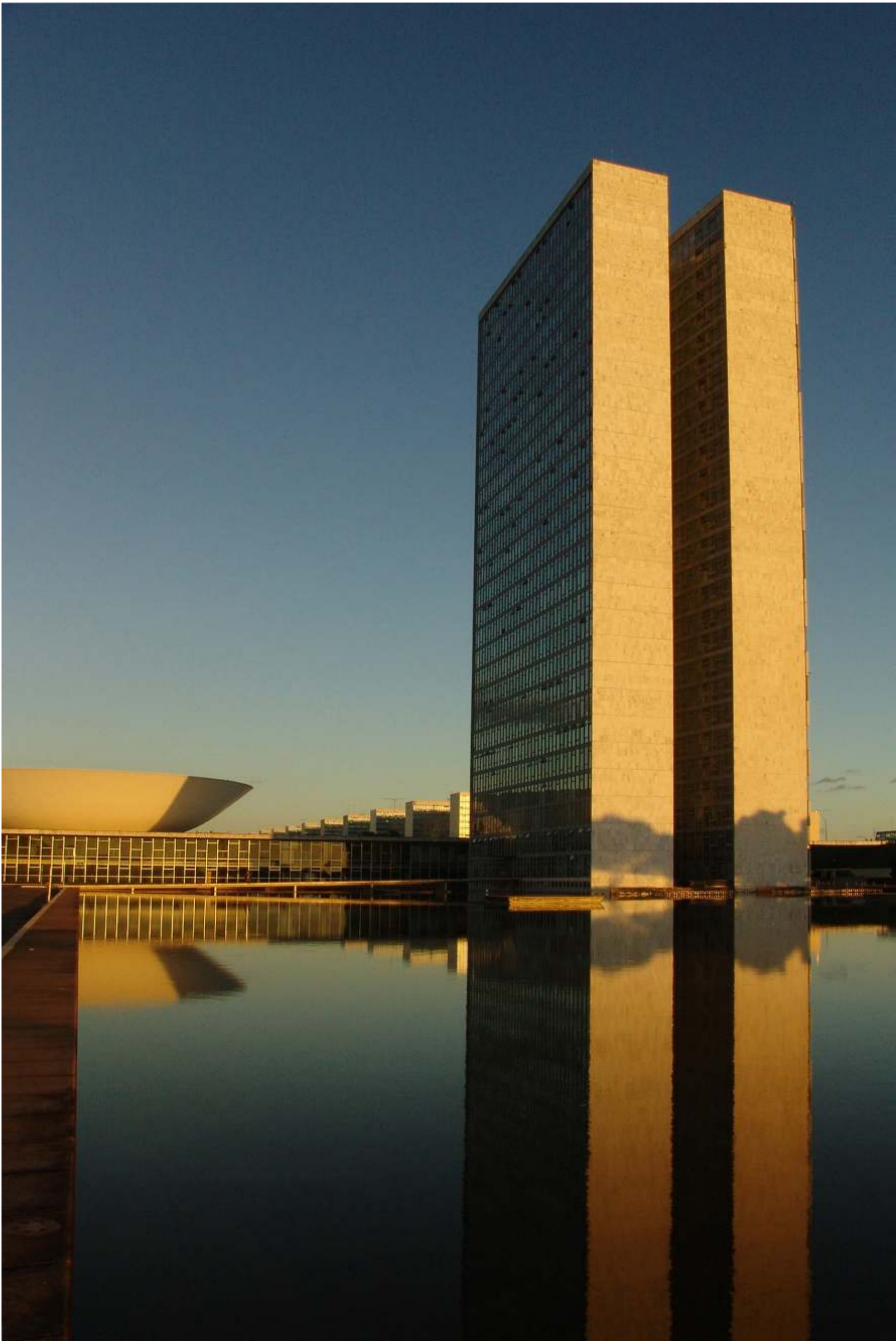
Câmara dos Deputados - Palácio Nacional do Congresso