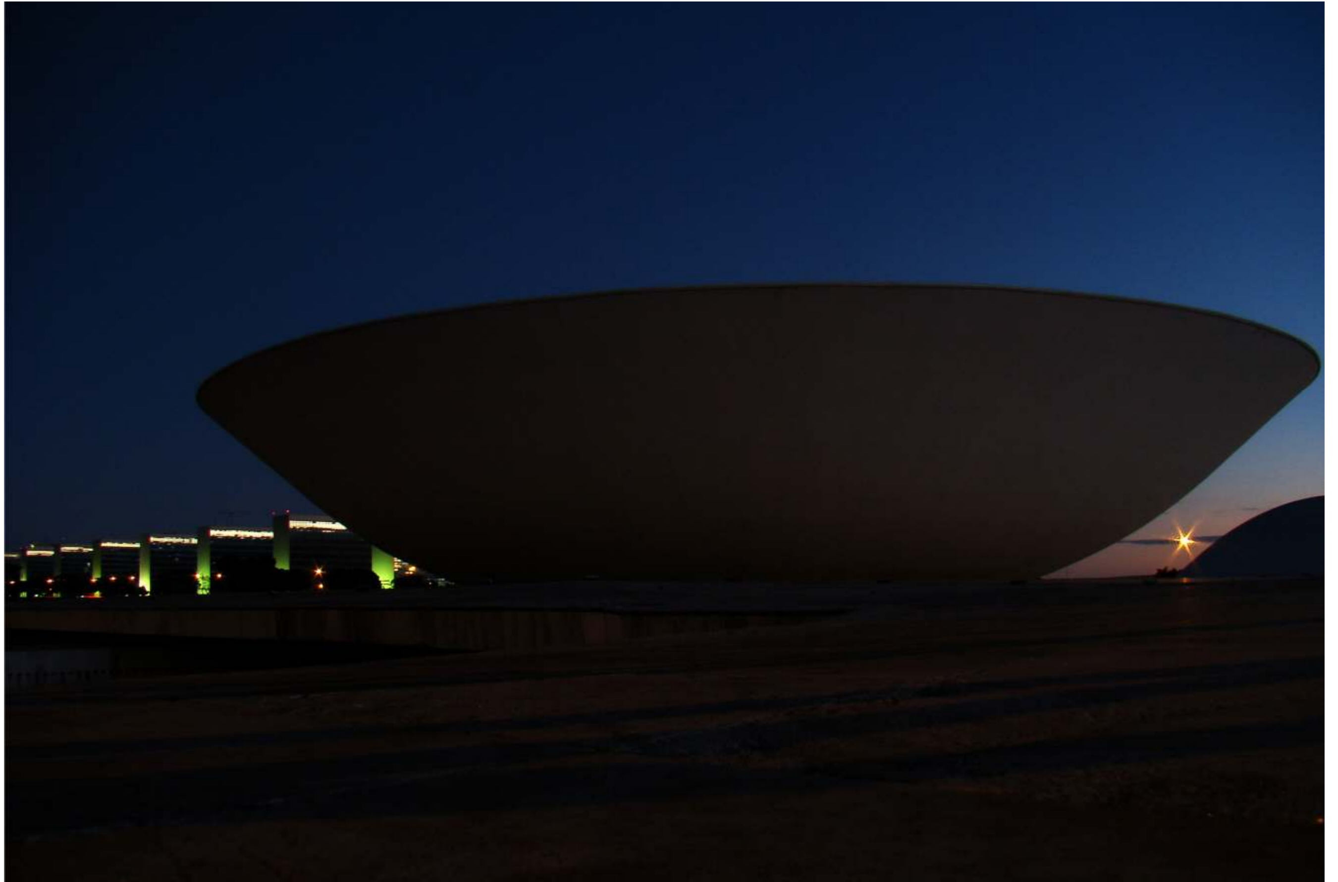
Câmara dos Deputados - Palace of the National Congress