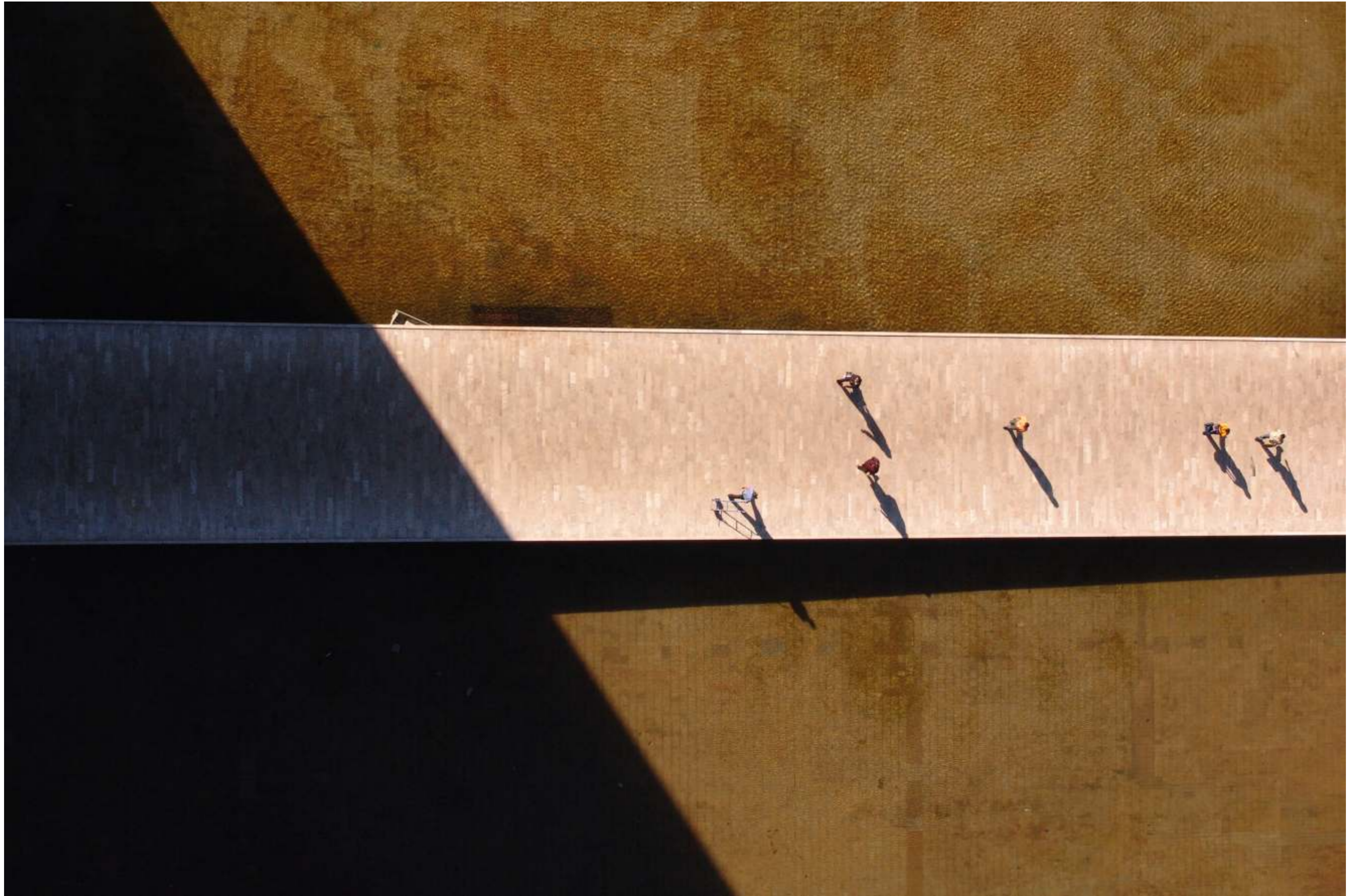
Congresso Nacional - Palace of the National Congress