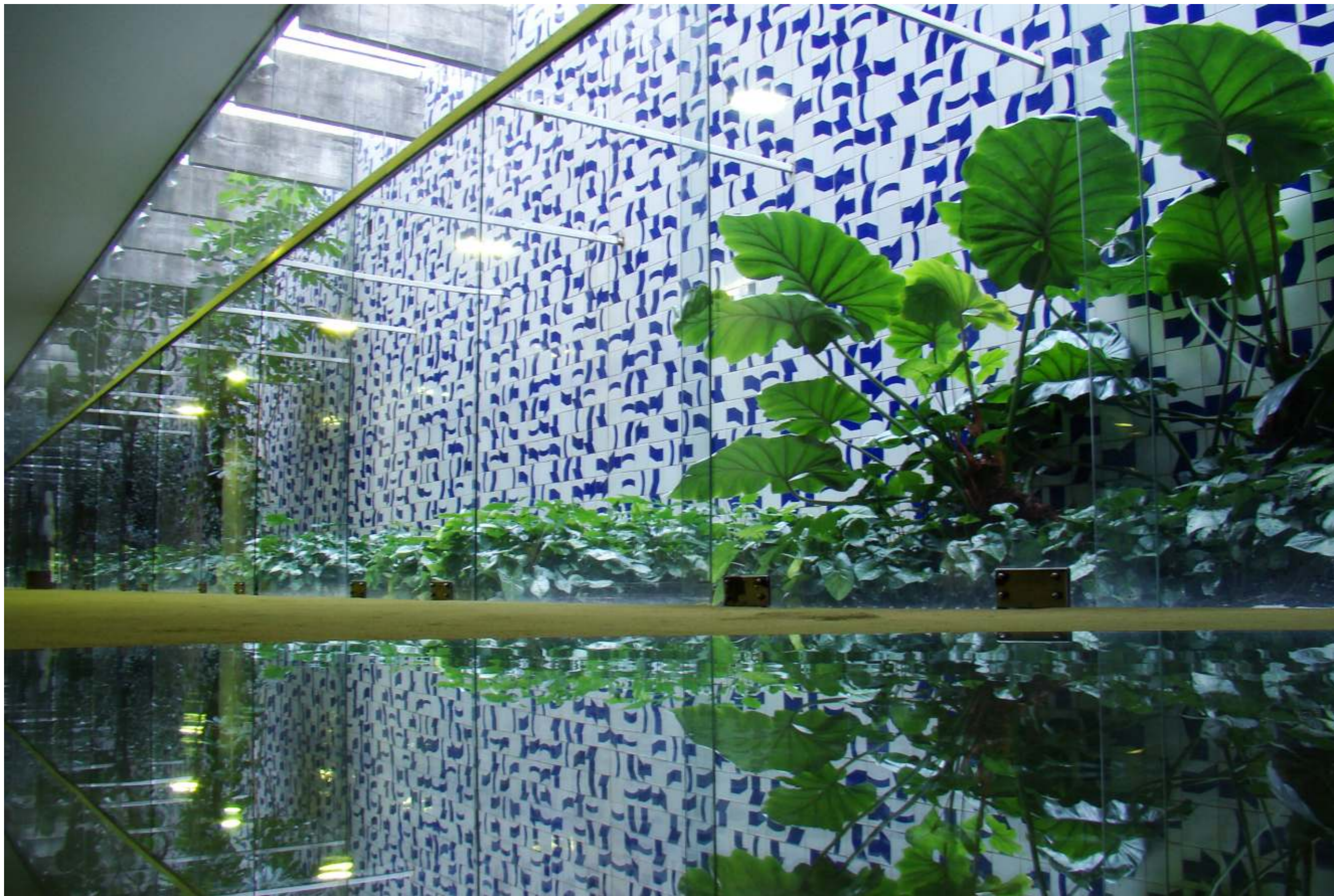
Câmara dos Deputados - Salão Verde - Painel Ventania - Palace of the National Congress