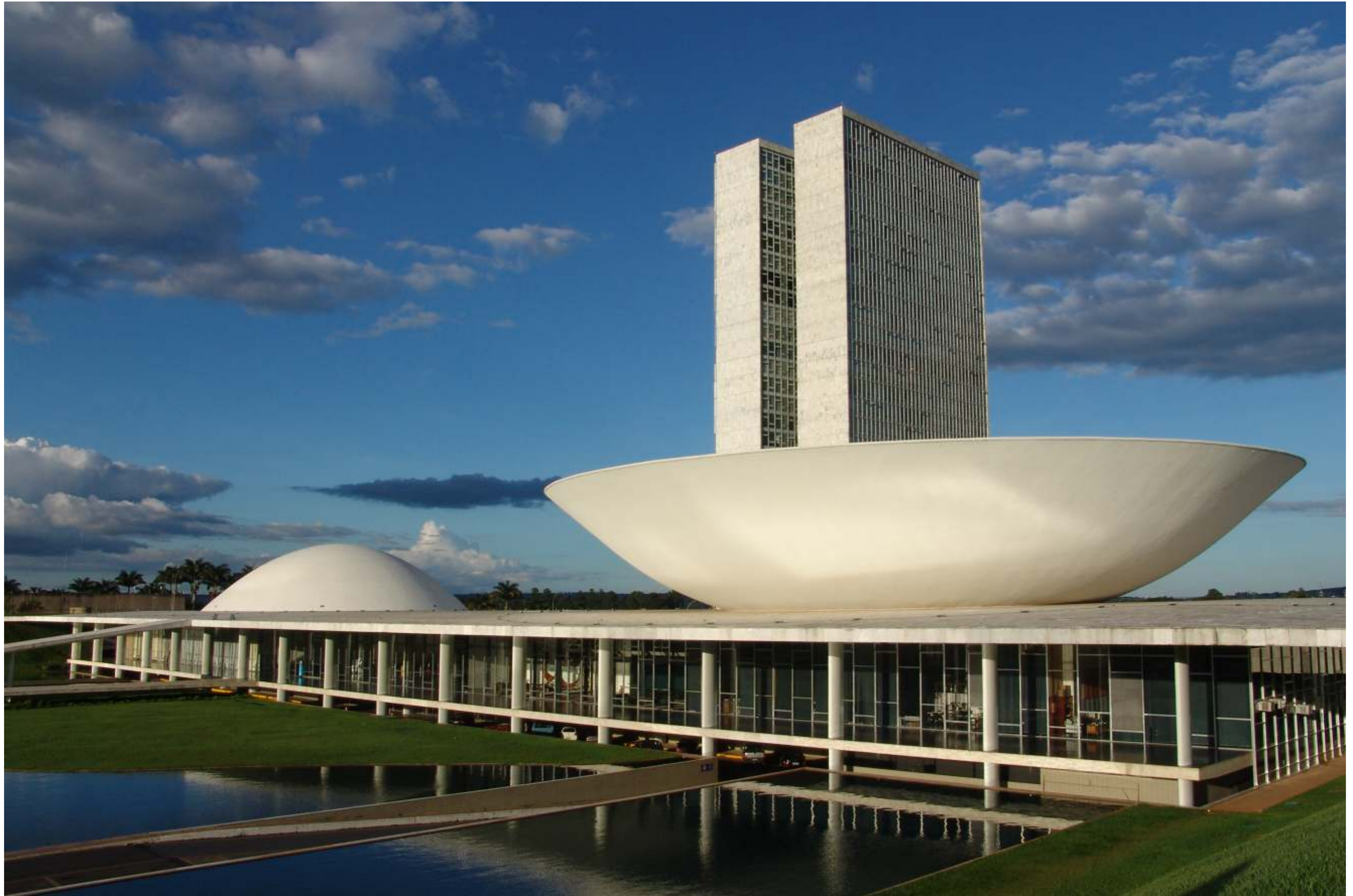
Congresso Nacional - Palace of the National Congress