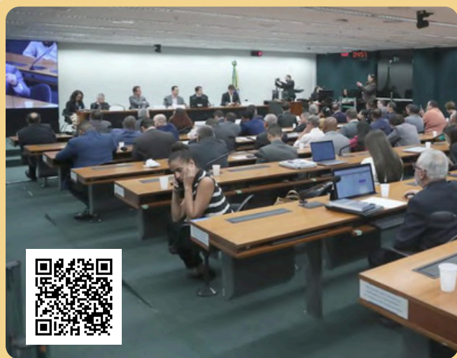
Bruno Spada / Câmara dos Deputados

O PLP 12/2024 tem significativas implicações em diversos setores da sociedade, especialmente para os trabalhadores que atuam no segmento do transporte privado individual de passageiros por meio de aplicativos. Na audiência, de iniciativa do presidente da CICS, deputado Josenildo (PDT/PA), foram debatidos os impactos social e econômico, uma vez que envolve aspectos como renda, condições de trabalho, benefícios e proteção social dos profissionais envolvidos. Outro ponto de destaque foi a regulação para a atividade com a definição de regras claras e equilibradas para se garantir a segurança dos usuários e profissionais, além da viabilidade econômica e a competitividade relacionadas às empresas do setor.