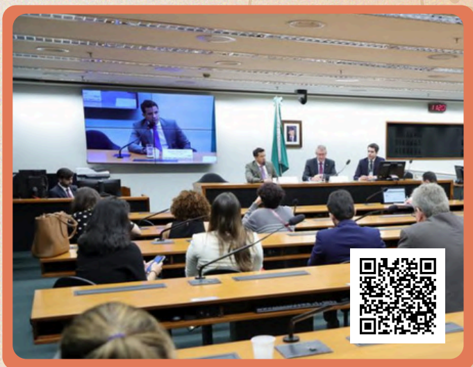
Mario Agra / Câmara dos Deputados

O Programa também tem relevantes impactos ambiental e social, na medida que promove a redução da poluição atmosférica e a mobilidade verde, tornando o transporte mais acessível e eficiente tanto para as áreas urbanas densamente povoadas como para as regiões mais remotas.