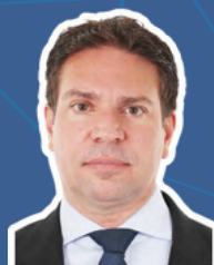
Delegado Ramagem PL/RJ