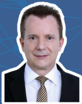
Celso Russomanno Republicanos/SP