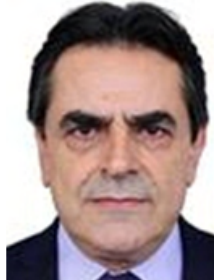
Domingos Sávio (PL/MG)