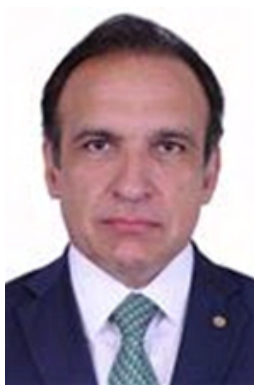
1º VICE-PRESIDENTE HUGO LEAL (PSD/RJ)