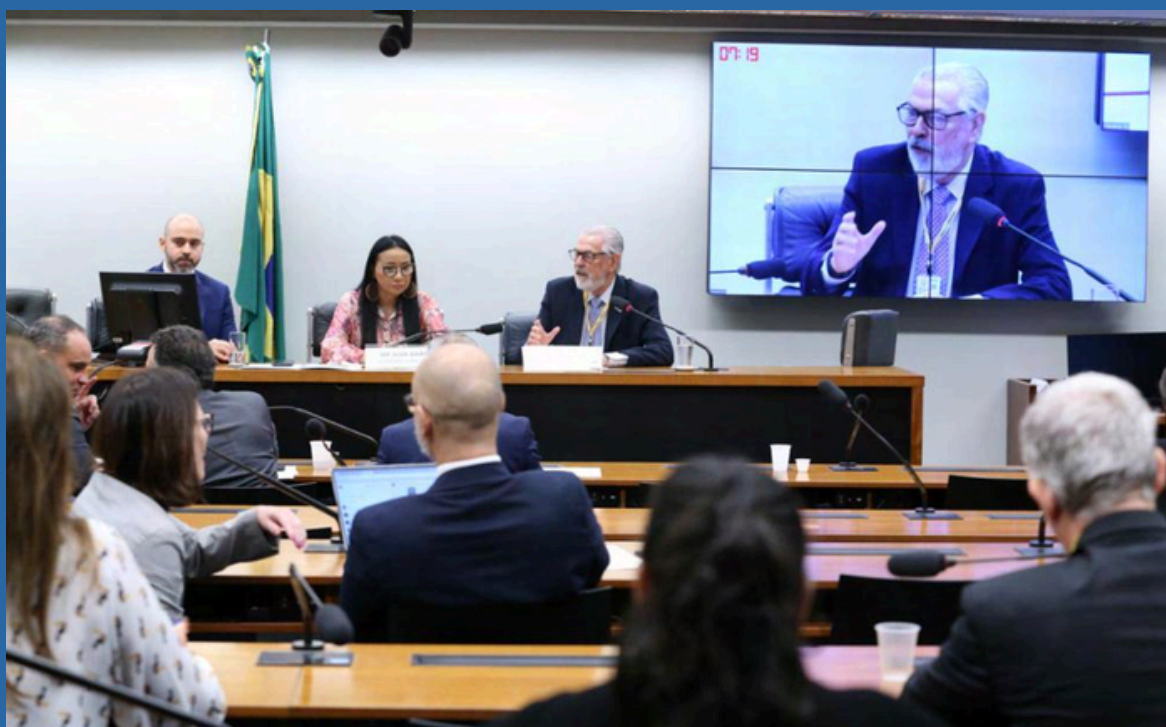
ELIO RIZZO / CÂMARA DOS DEPUTADOS DATA: 02/07/2024