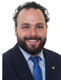
Ulisses Guimarães (MDB/MG)