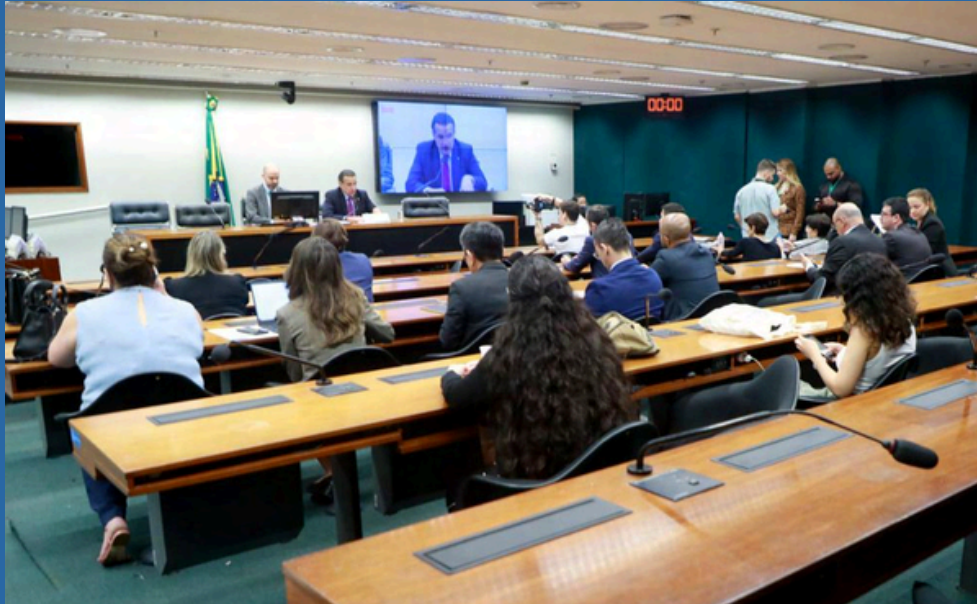
MARIO AGRA / CÂMARA DOS DEPUTADOS DATA: 05/12/2024