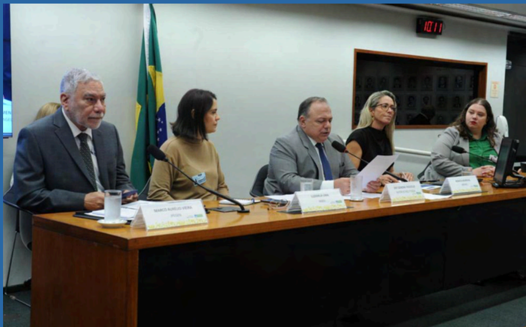
DATA: 12/12/2024