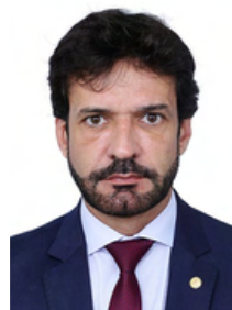
Marcelo Álvaro Antônio (PL/MG)