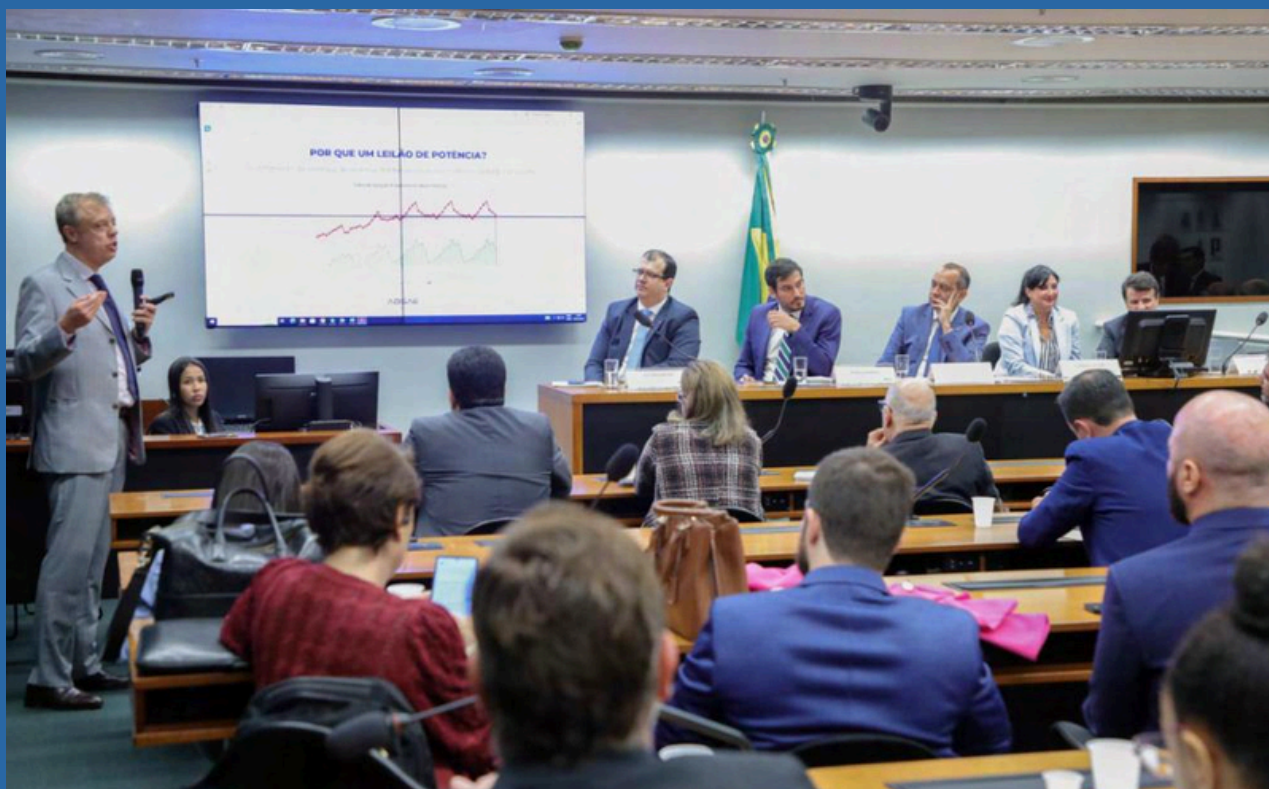
DATA: 07/05/2024