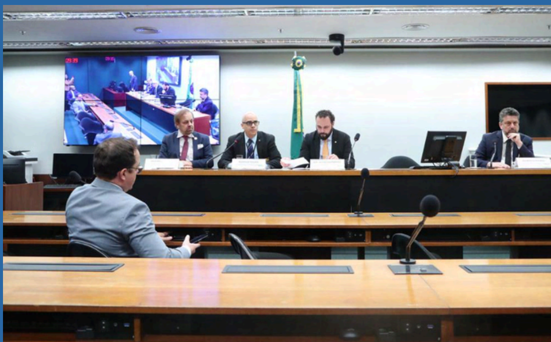
DATA: 11/06/2024