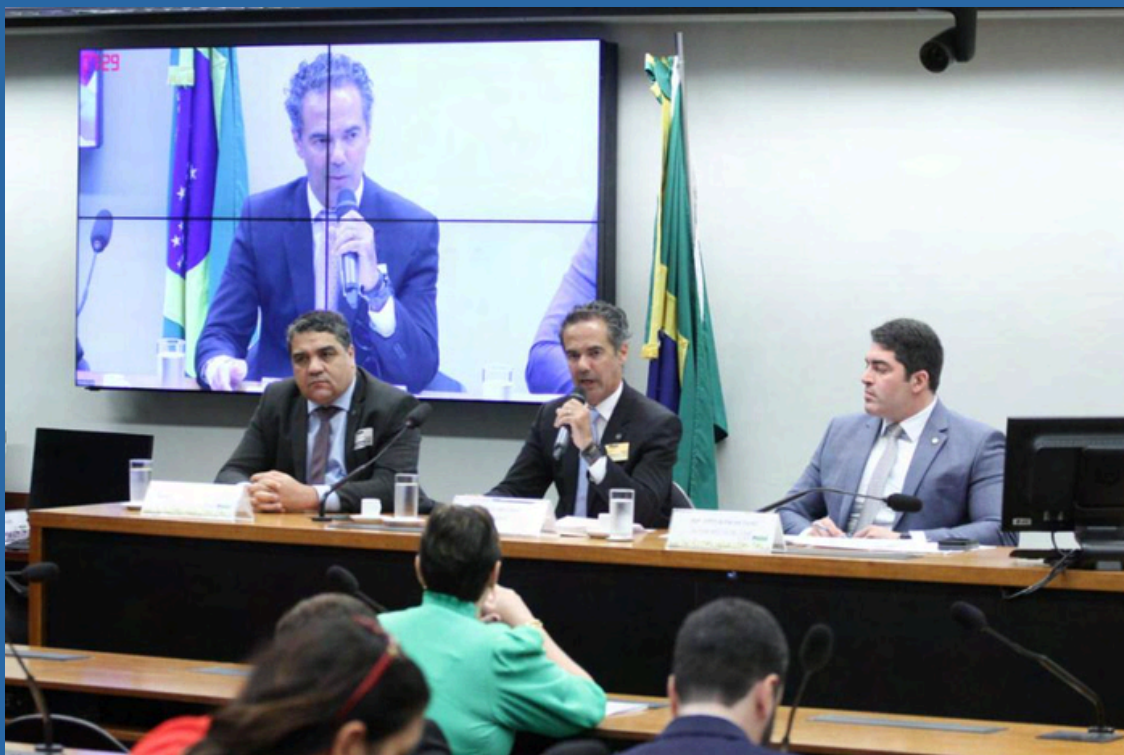
DATA: 21/05/2024