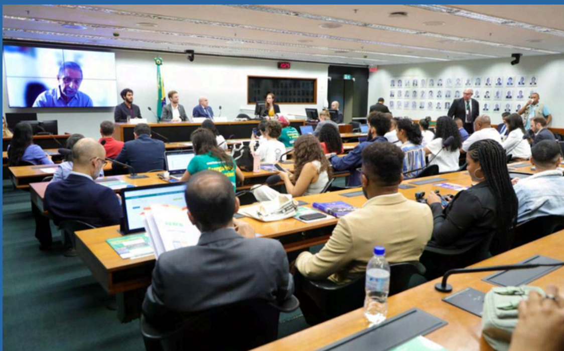
MARIO AGRA / CÂMARA DOS DEPUTADOS DATA: 29/05/2024