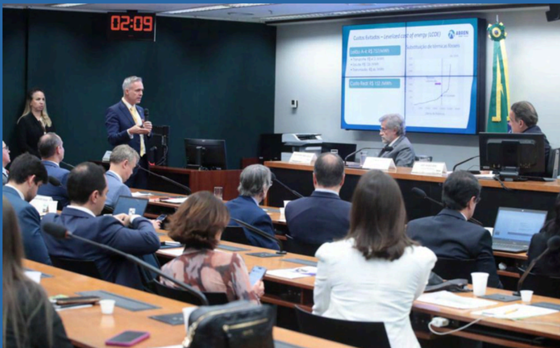
DATA: 04/07/2024