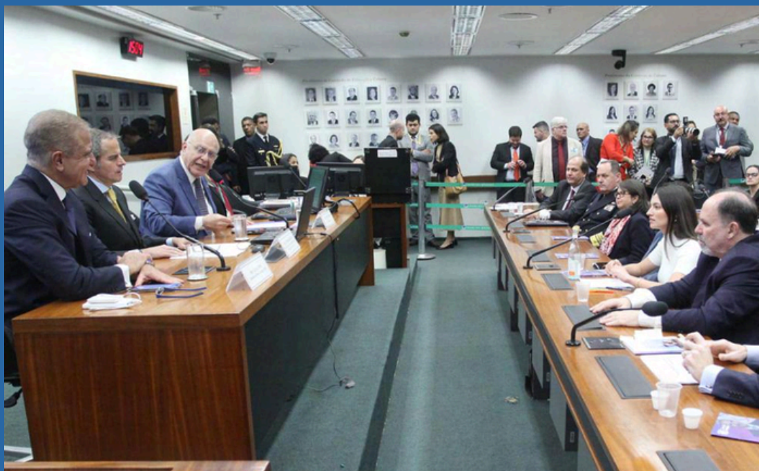
DATA: 19/06/2024

REQ 29/2024 CME- JULIO LOPES REQ 52/2024 CME - ARNALDO JARDIM