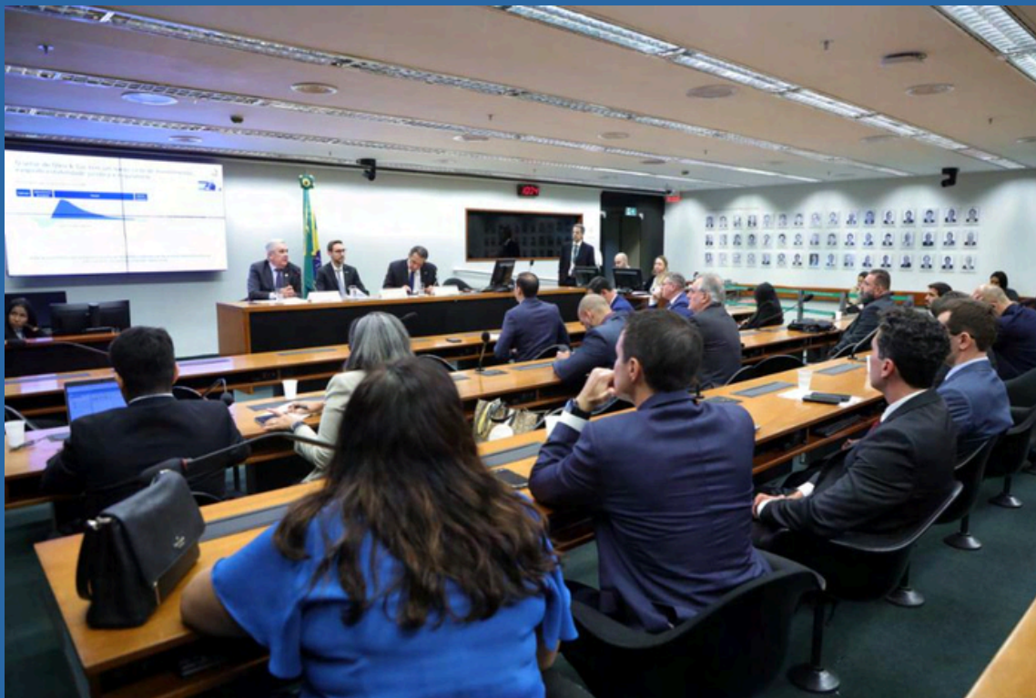
DATA: 28/05/2024