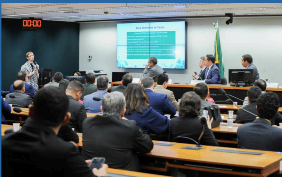
DATA: 18/06/2024