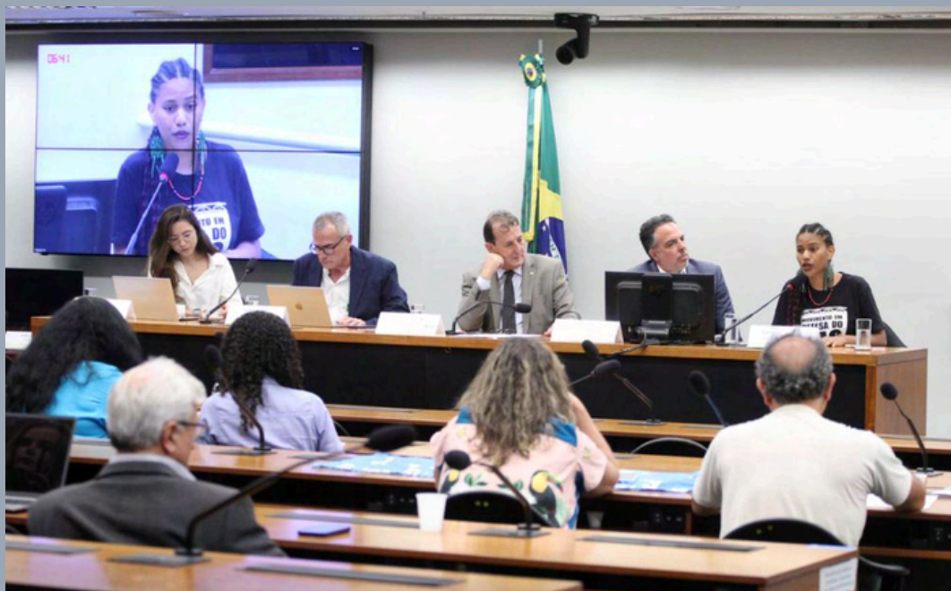
DATA: 10/12/2024

REQ 55/2024 CMADS E REQ 79/2024 CME - NILTO TATTO