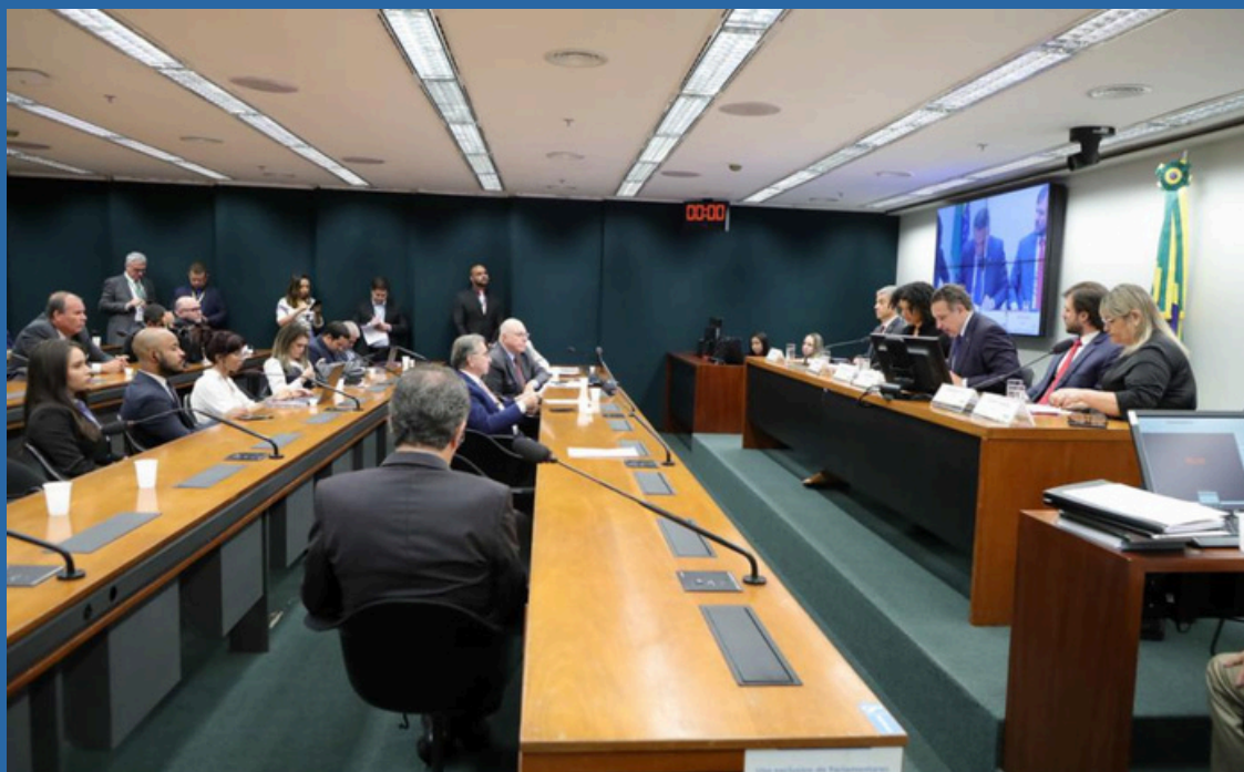
MARIO AGRA / CÂMARA DOS DEPUTADOS DATA: 16/04/2024