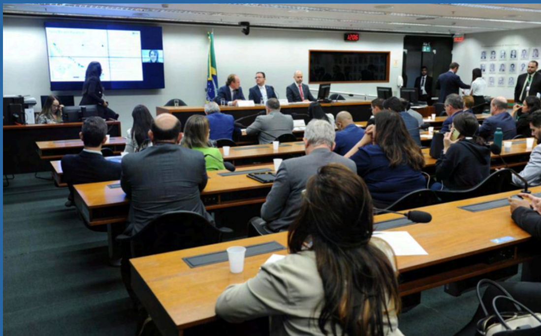
DATA: 27/11/2024

REQ 23/2024 CME- JÚNIOR FERRARI REQ 25/2024 CME- SIDNEY LEITE REQ 93/2024 CME- SILVIA WAIÃPI