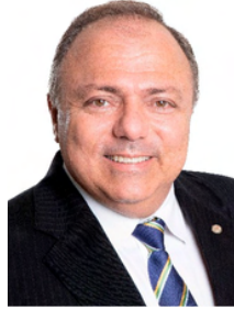
General Pazuello (PL/RJ)