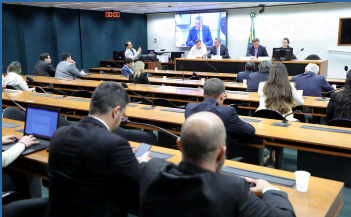
MARIO AGRA / CÂMARA DOS DEPUTADOS DATA: 14/05/2024