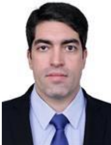
Otto Alencar Filho (PSD/BA)