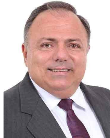
General Pazuello (PL/RJ)