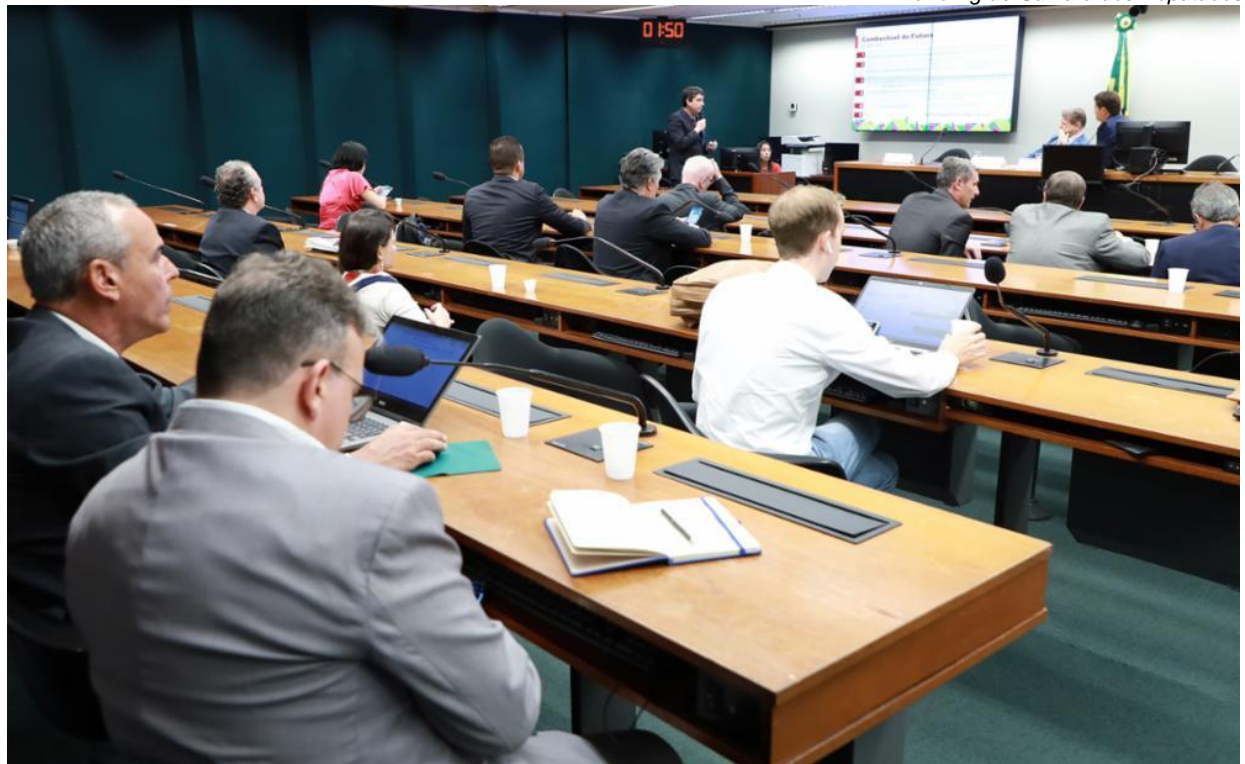
Mario Agra / Câmara dos Deputados