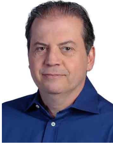
Presidente Rodrigo de Castro (UNIÃO/MG)