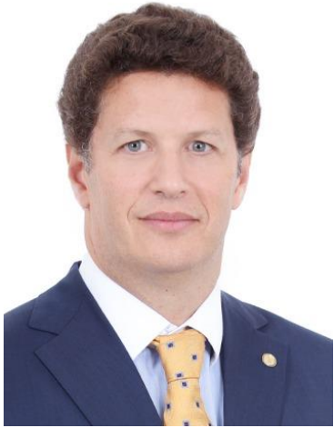
Ricardo Salles (PL/SP)