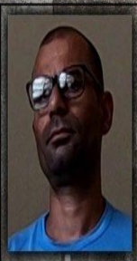
Abel Vida Loka

A guerrilha foi, pegou umas autoridades, aí falou: "Ó, dou tantos dias pra liberar."