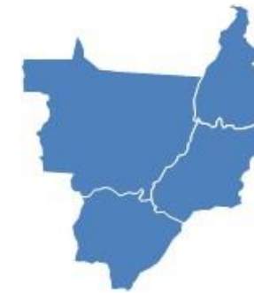
V - Região Centro Oeste, exceto setores 22 e 25 do PGO