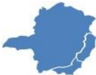
VII - Estados do RJ, ES e MG, exceto setor 3 do PGO