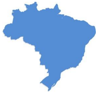
I - Nacional