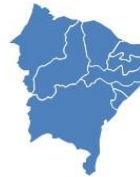
IV - Região Nordeste