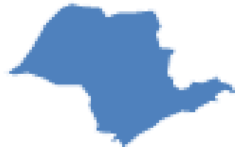
VIII - Estados de SP, exceto setor 33 do PGO