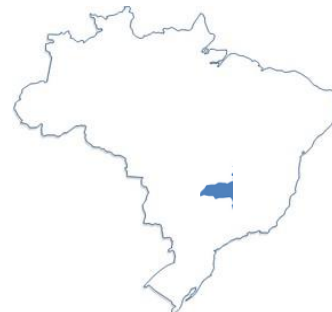
IX - Setores 3, 22, 25 e 33 do PGO

....alertamos que a “disputa” por faixas pode acontecer apenas nos blocos regionais.