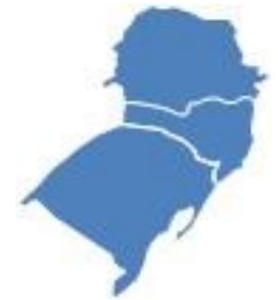
VI - Região Sul