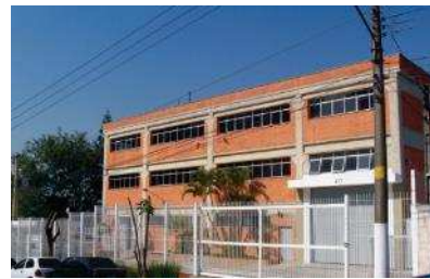
Thales Barueri (SP)