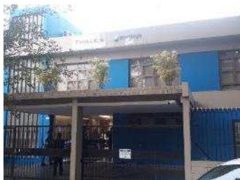
Thales e Omnisys São Bernardo do Campo (SP)