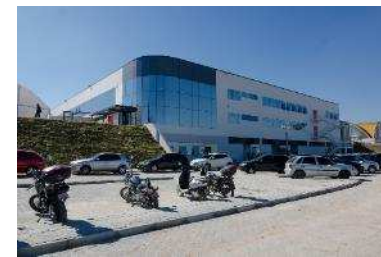
Thales Pinhais (PR)