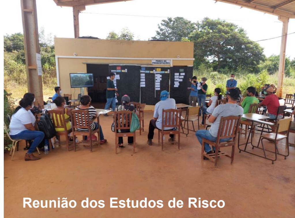
Reunião dos Estudos de Risco