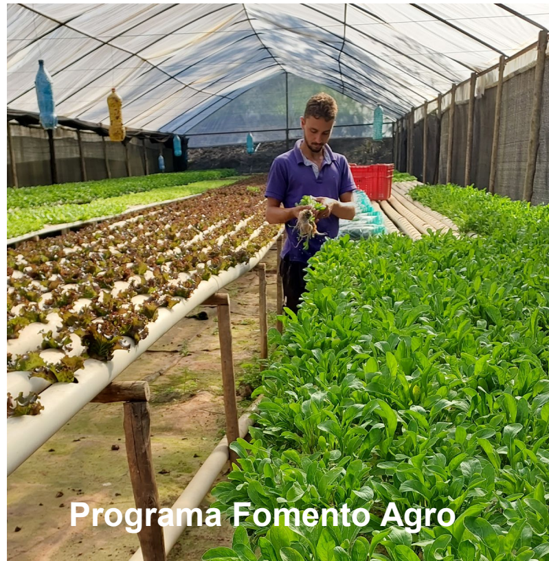
Programa Fomento Agro