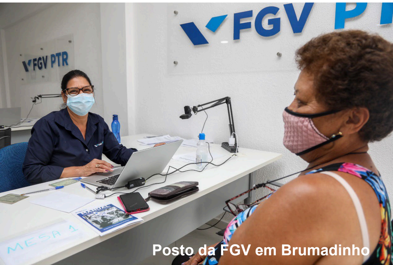
Posto da FGV em Brumadinho

Segundo a FGV, 51.086 pessoas recebem o Programa em Brumadinho. Destas, 13.693 recebem o valor integral (abril/23).