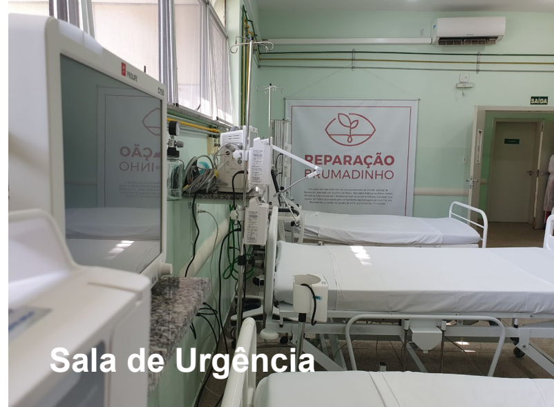
Sala de Urgência