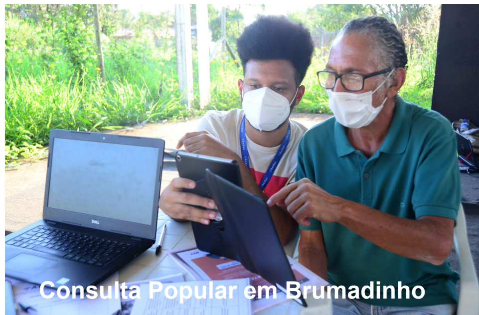
Consulta Popular em Brumadinho

A execução dos projetos cabe à Vale, com acompanhamento realizado pela auditoria socioeconômica contratada, a Fundação Getulio Vargas