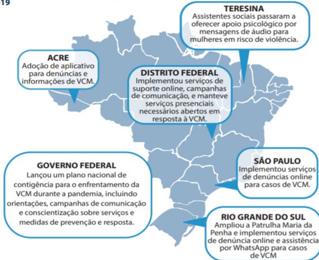
Figura 2. Seleção de exemplos de políticas governamentais implementadas em todo o Brasil durante a COVID-19