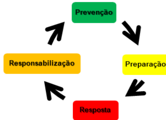
Figura 01 – Ciclo da Temporada de Incêndios Florestais

Para cumprir suas missões constitucionais, o Corpo de Bombeiros Militar deve desenvolver atividades relacionadas aos incêndios florestais durante todo o ano, para que todas as fases do ciclo da temporada de incêndio florestal sejam cumpridas (Figura 01), e não somente a fase resposta, onde grande parte dos esforços são voltados para o combate aos incêndios florestais e queimadas ilegais.