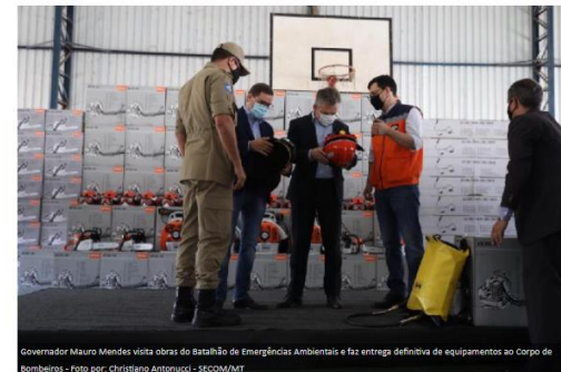
Governador Mauro Mendes visita obras do Batalhão de Emergências Ambientais e faz entrega definitiva de equipamentos ao Corpo de Bombeiros