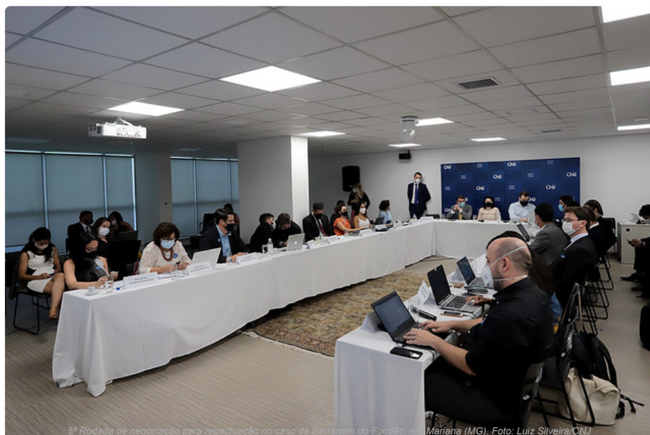
5ª Rodada de negociação para repactuação no caso da Barragem do Fundão, em Mariana (MG).

Questões relacionadas a indenizações, assessorias técnicas independentes e incentivo à economia da região do Rio Doce, atingida pelo rompimento da Barragem do Fundão, em Mariana (MG), foram algumas das propostas analisadas na 5ª Rodada de Negociação. Mediado pelo Conselho Nacional de Justiça (CNJ), o encontro ocorreu entre os dias 13 e 16 de dezembro, em Brasília. Novas etapas devem ser realizadas em fevereiro de 2022, após a realização da última audiência pública.