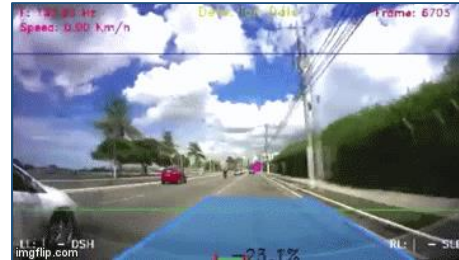
Mudança de faixa