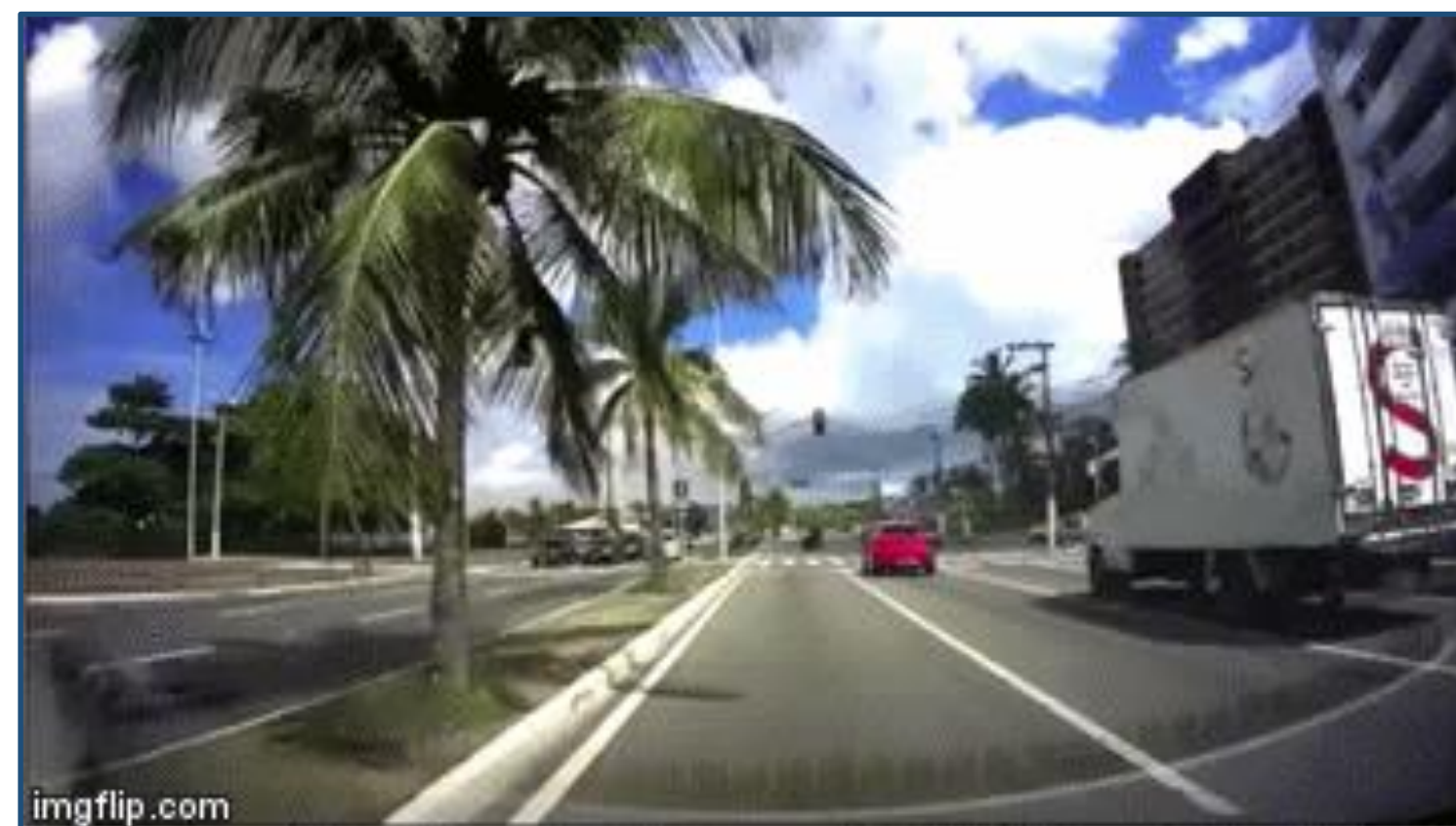
Avanço de sinal