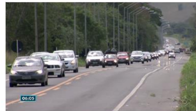
BR-262 tem trânsito intenso e muitos buracos na volta do feriadão, no ES

Por Diany Silva, TV Gazeta 16/10/2017 08:08 - Atualizado há 4 horas