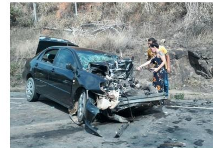
Carro bateu de frente com caminhão na BR-259, em Colatina

Por G1 ES 16/10/2017 09:49 - Atualizado há 5 horas