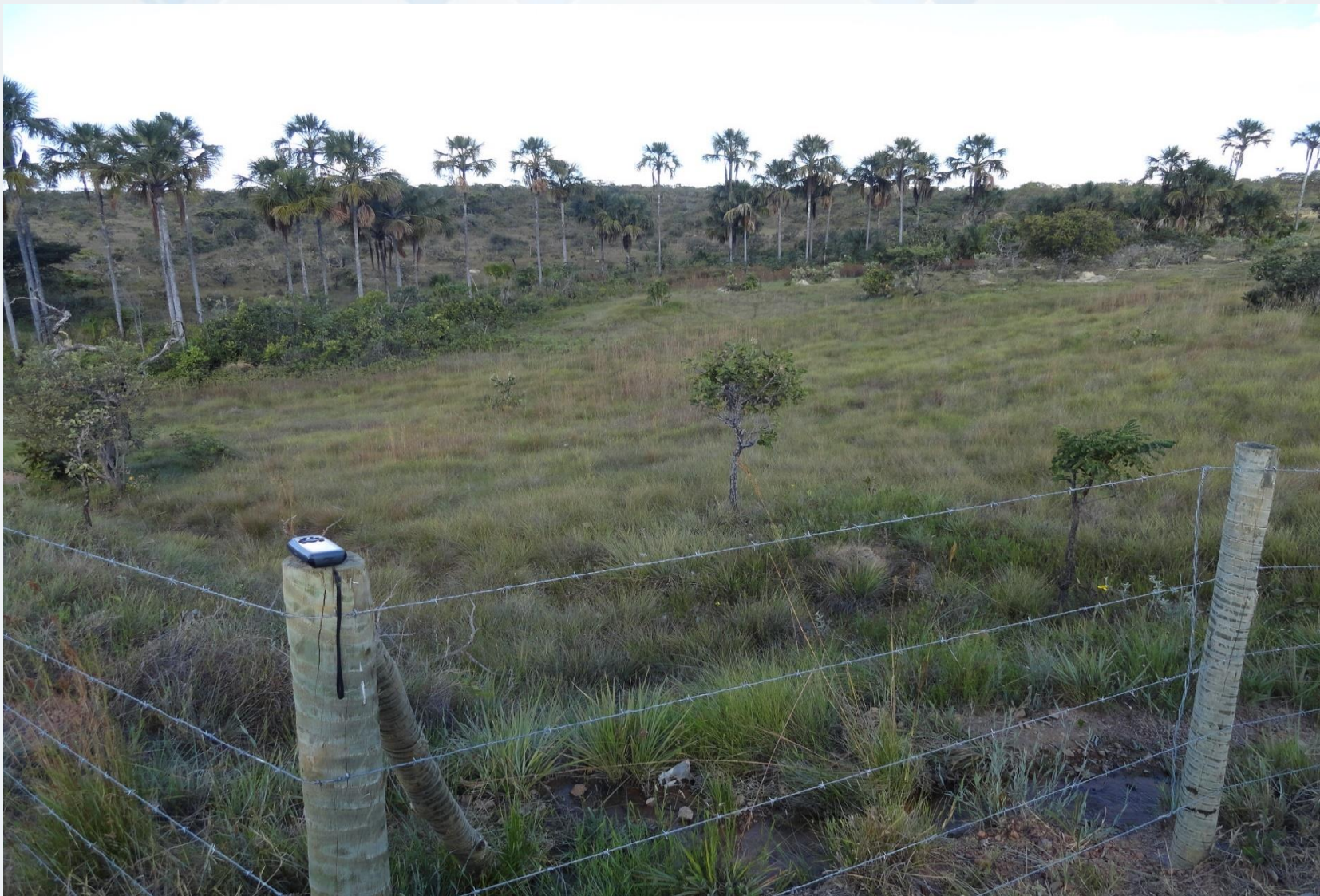
Microbacia Córrego Capivara – Buritizeiro/MG