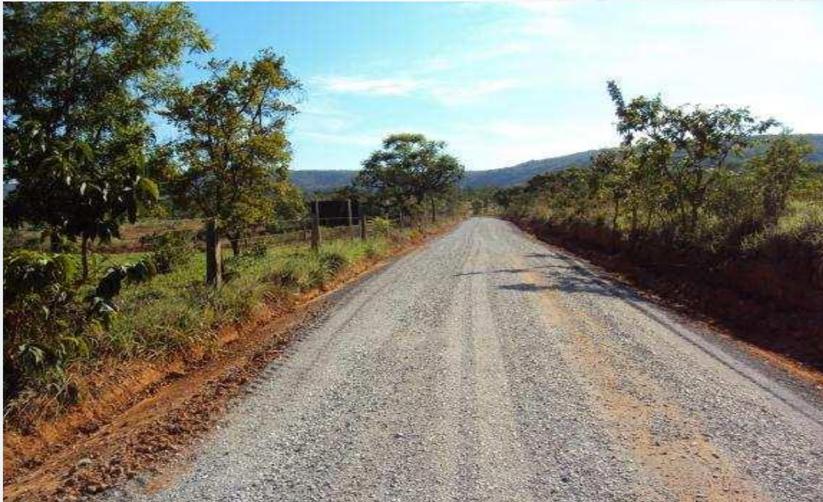
Microbacia Córrego Matias – Paraopeba/MG