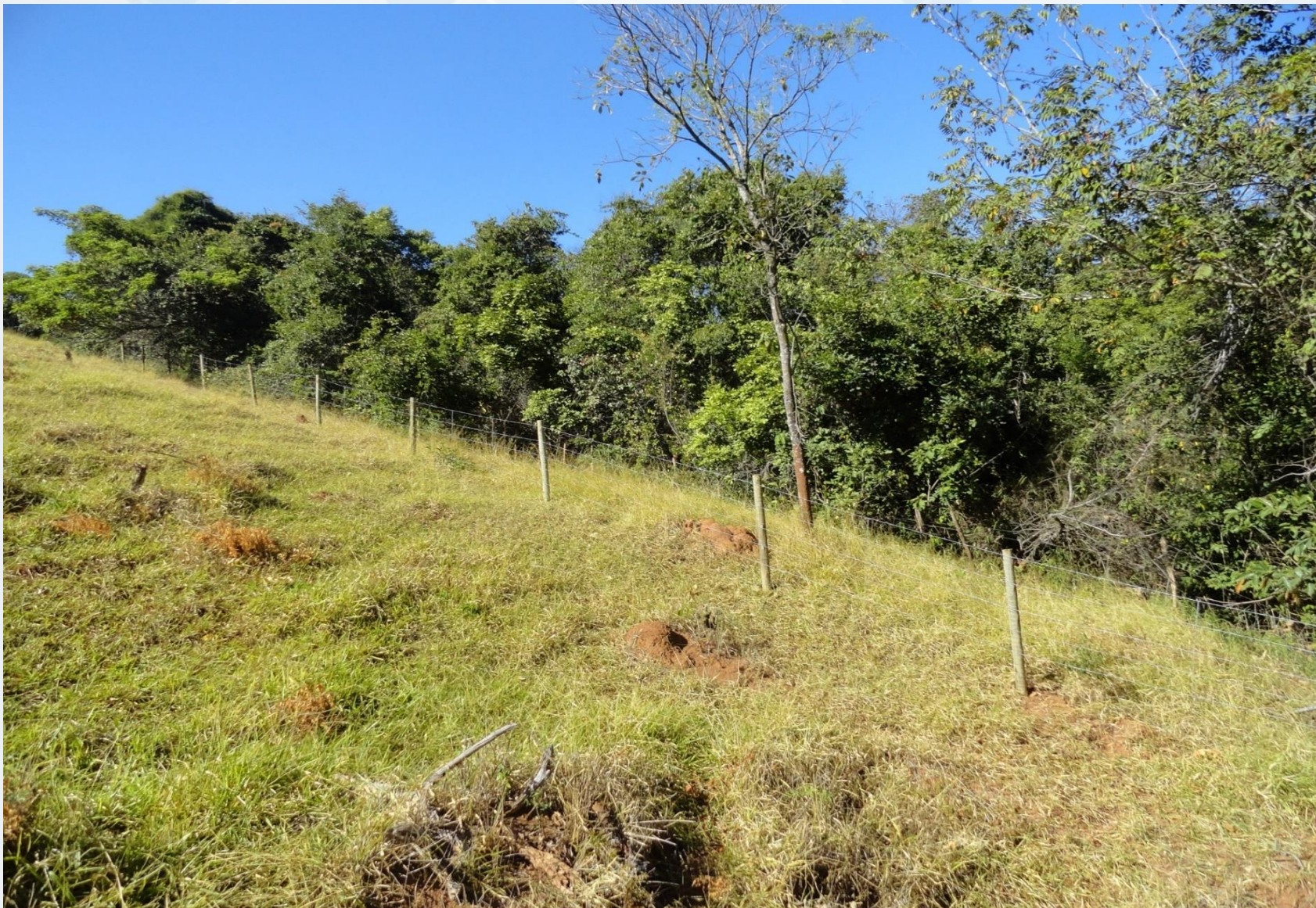
Microbacia Córrego do Baú – Onça do Pitangui/MG