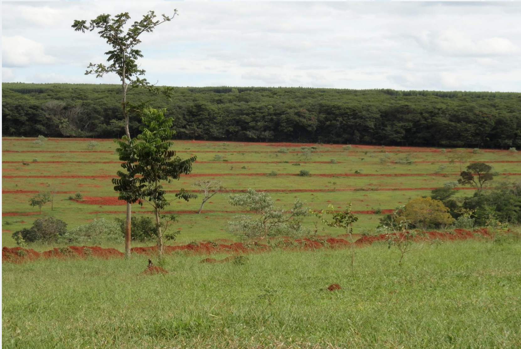
Microbacia Córrego Mandassaia – Papagaios/MG