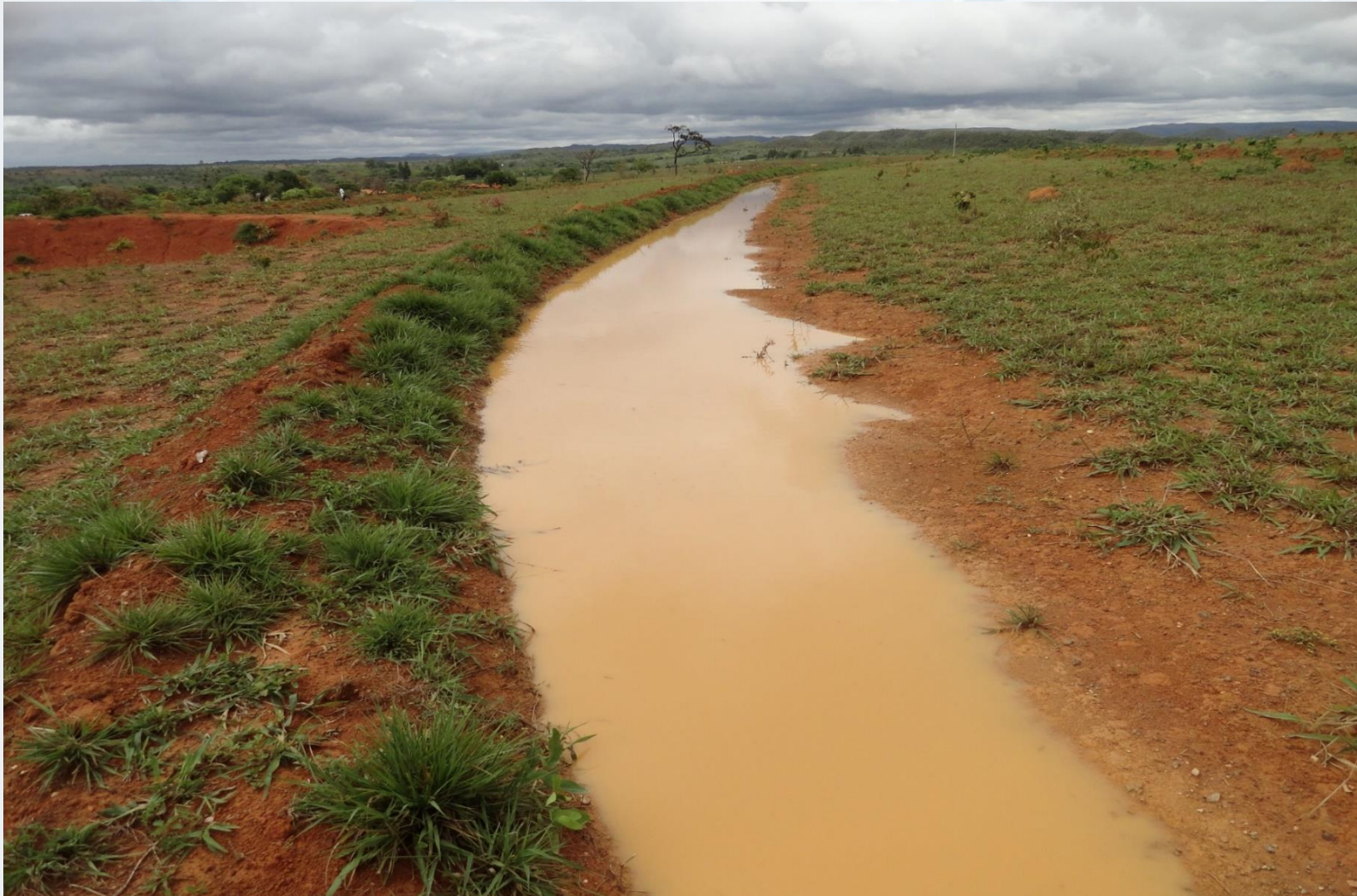
Microbacia Ribeirão Areia – Unaí/MG