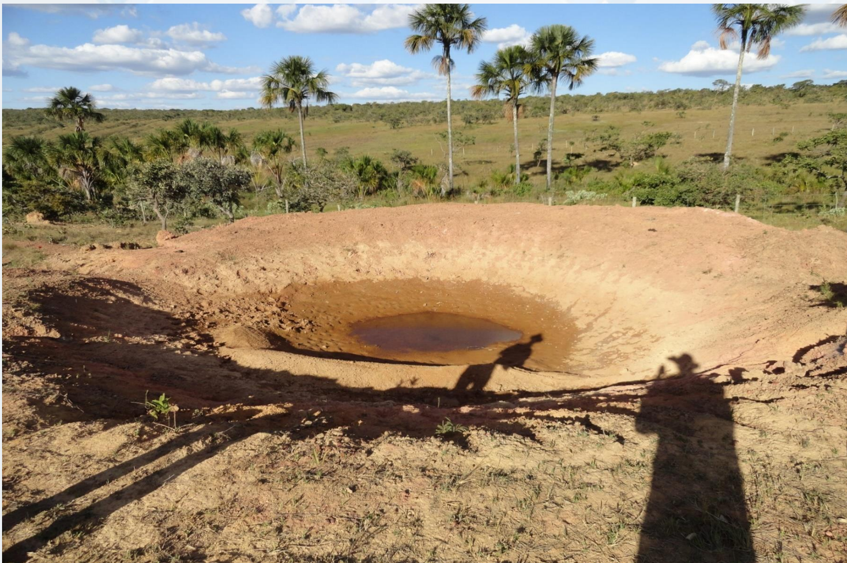
Microbacia Ribeirão Boa Vista – Formoso/MG