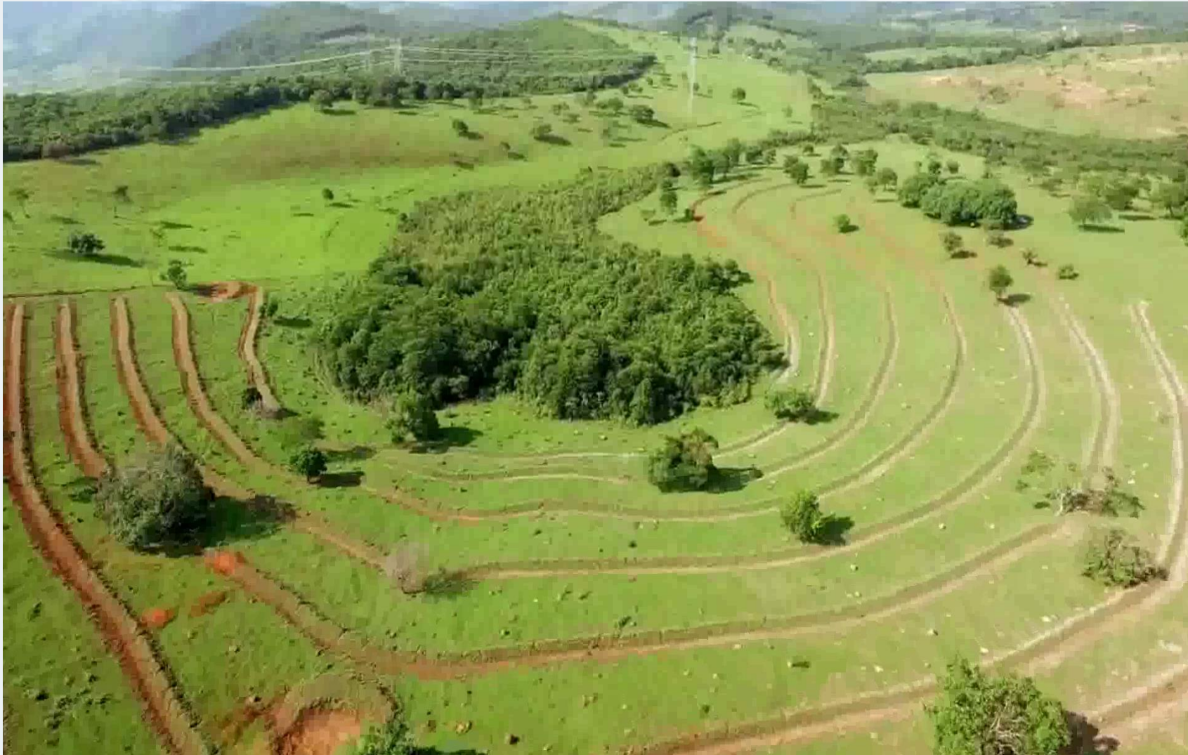
Microbacia Córrego Cachoeirinha – Itaúna/MG