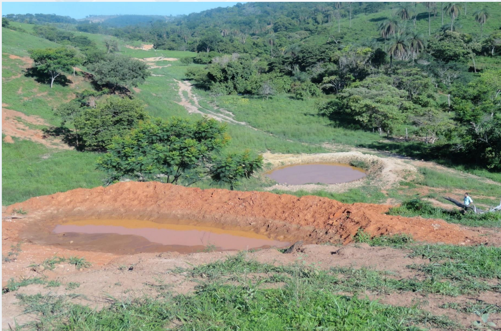
Microbacia Córrego Tição – Jaboticatubas/MG