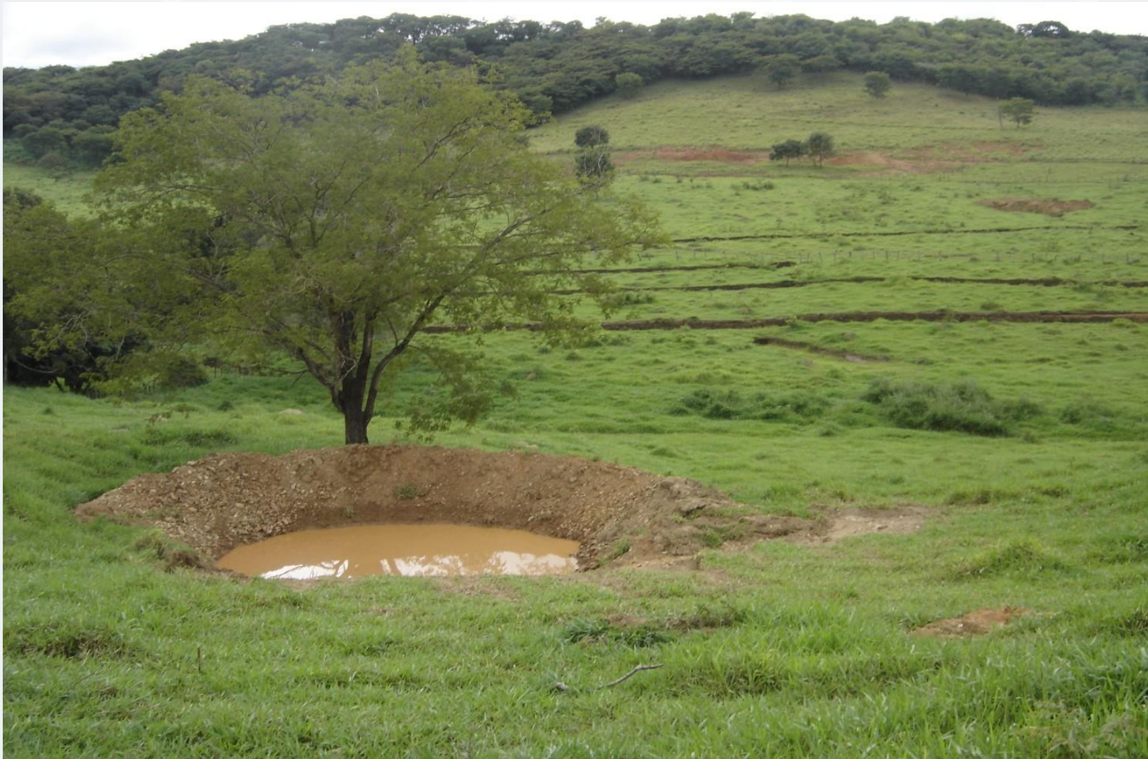
Microbacia Córrego das Pedras – Guaraciama/MG