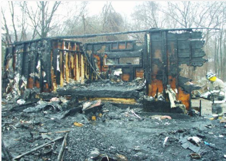
2003 – Station Nightclub West Warwick, RI, EUA