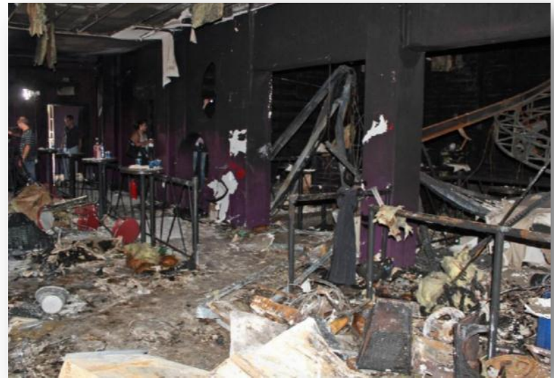
2013 – Boate Kiss Santa Maria, RS, Brasil