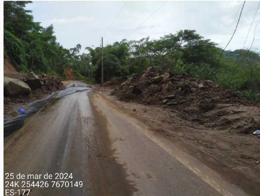
Escorregamento 02 - Imagem da pista após a ocorrência do desastre.