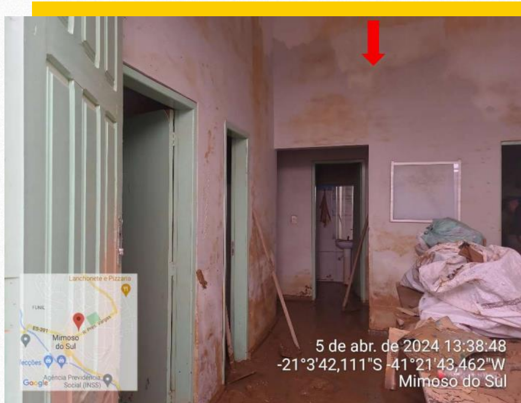
Prédio do Conselho Tutelar de Mimoso do Sul

Repasse de R$ 2.964.948,83 para restabelecer prédios e praças públicas.