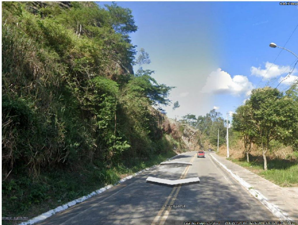
Escorregamento02 - Imagem da pista antes da ocorrência do desastre. Fonte: Google Street View, julho de 2021