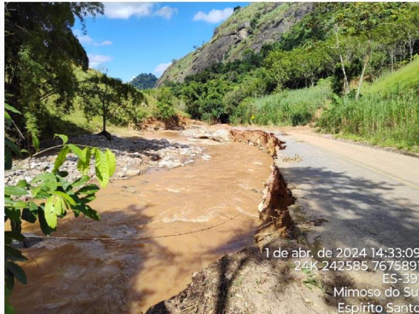
Escorregamento 01 - Imagem da pista após a ocorrência do desastre.