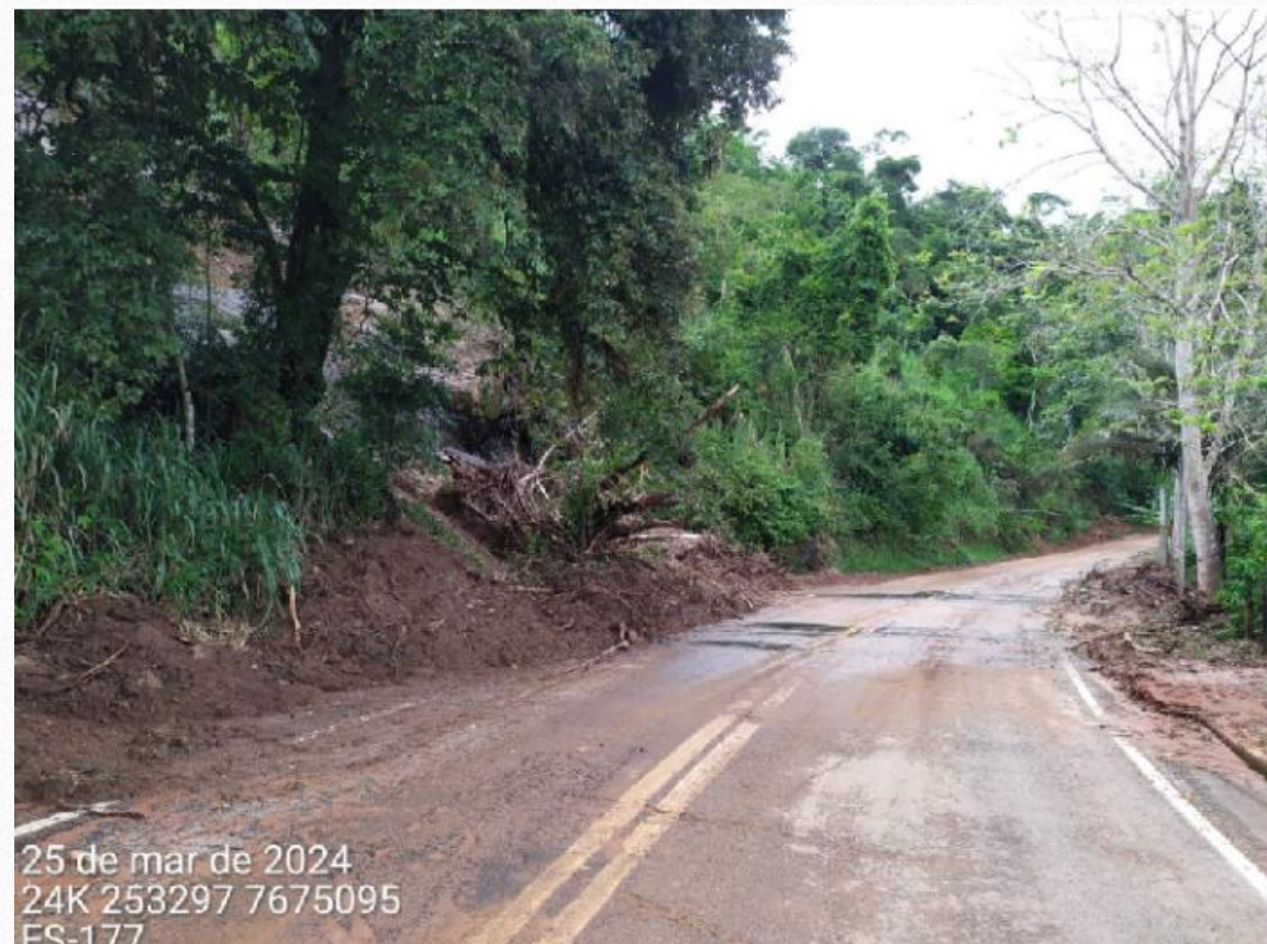
Escorregamento 01 - Imagem da pista após a ocorrência do desastre.