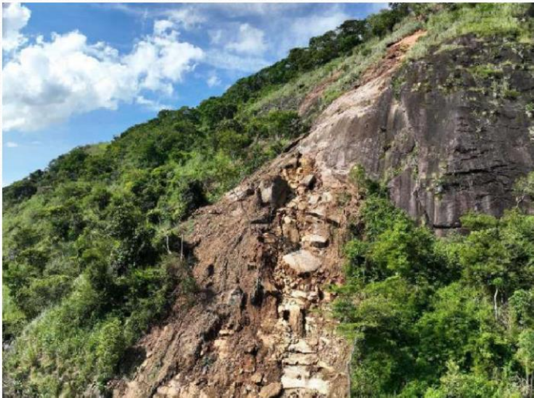
Escorregamento 02 - Imagem após a ocorrência do desastre.