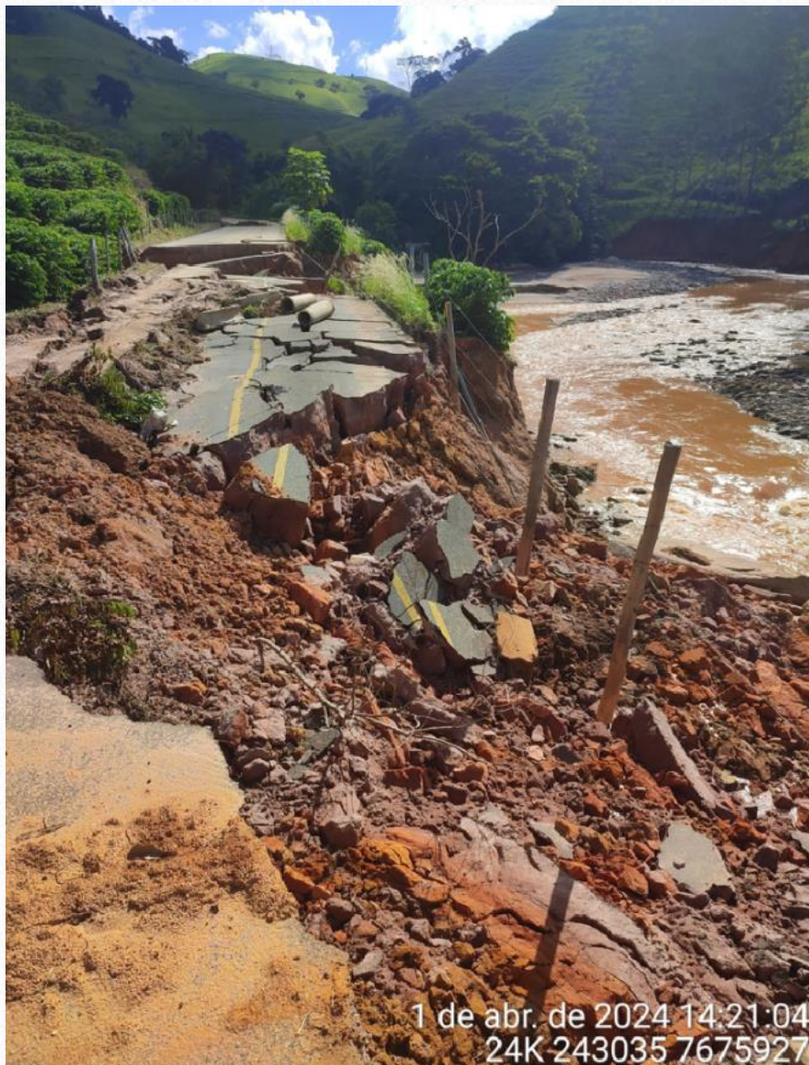
Escorregamento 01 - Imagem da pista após a ocorrência do desastre.