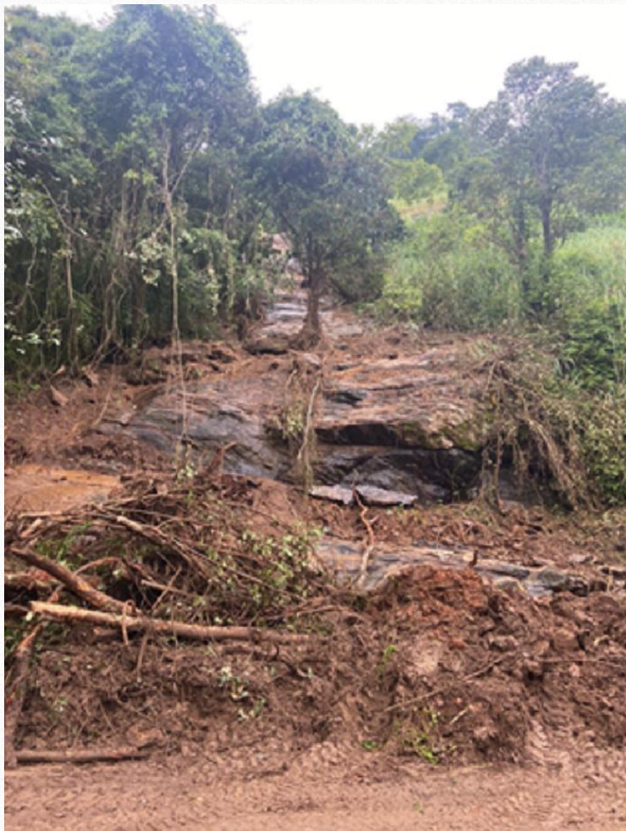
Escorregamento 01 - Imagem da pista após a ocorrência do desastre.