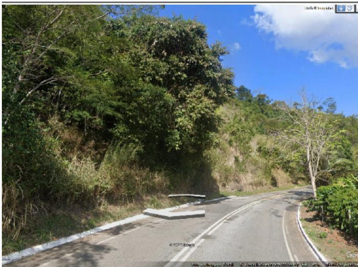
Escorregamento 01 - Imagem da pista antes da ocorrência do desastre.