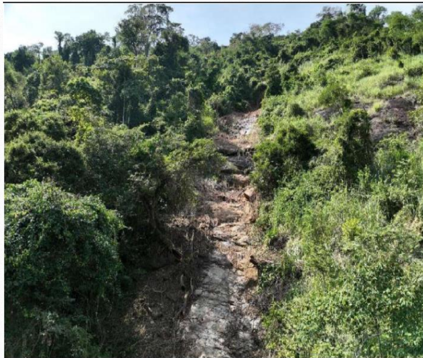
Escorregamento 01 - Imagem da pista após a ocorrência do desastre.