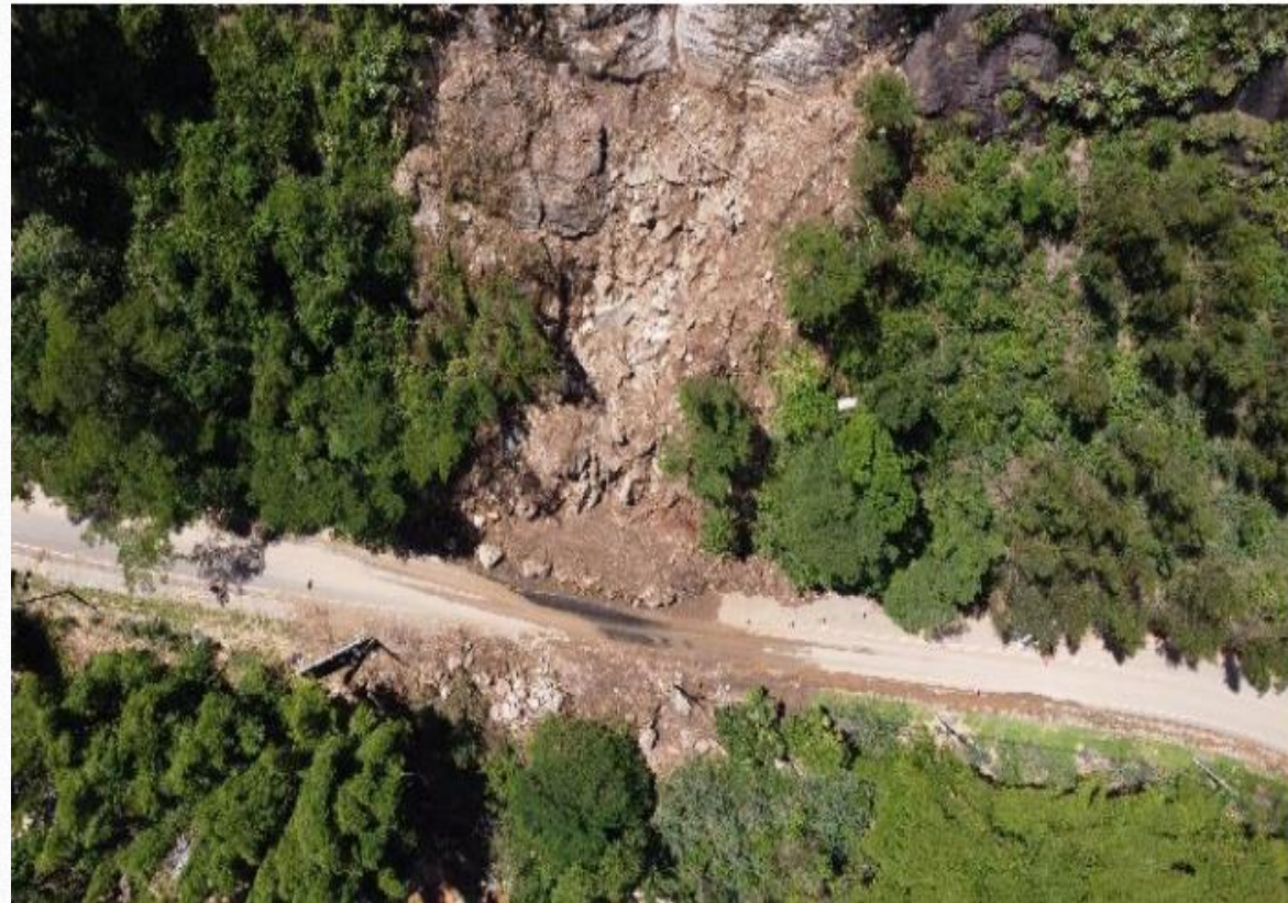
Escorregamento 02 - Imagem da pista após a ocorrência do desastre.