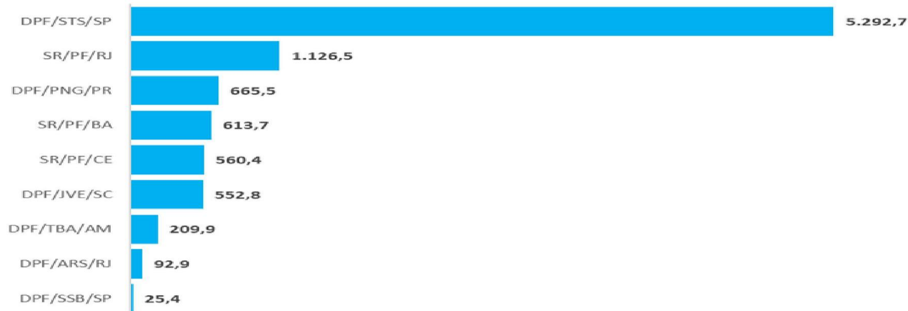
Apreensão de cocaína em Portos Brasileiros - 2025