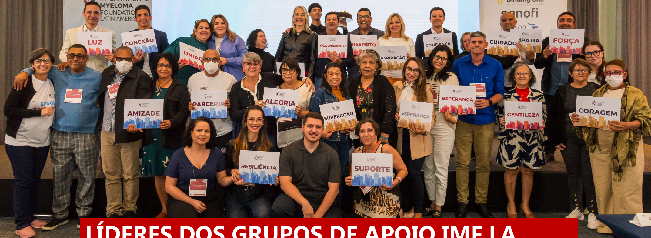
LÍDERES DOS GRUPOS DE APOIO IMF LA