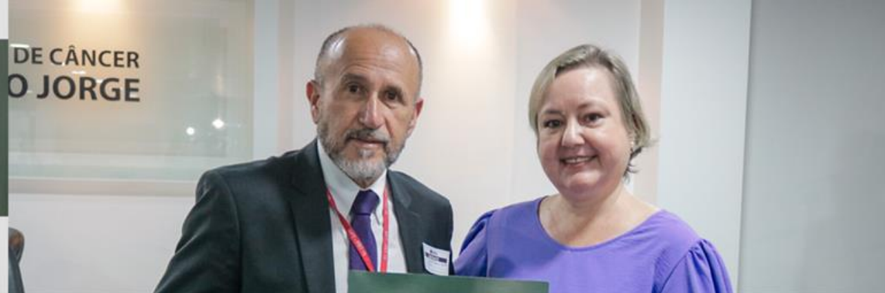
Ministério Público do Trabalho em Goiás