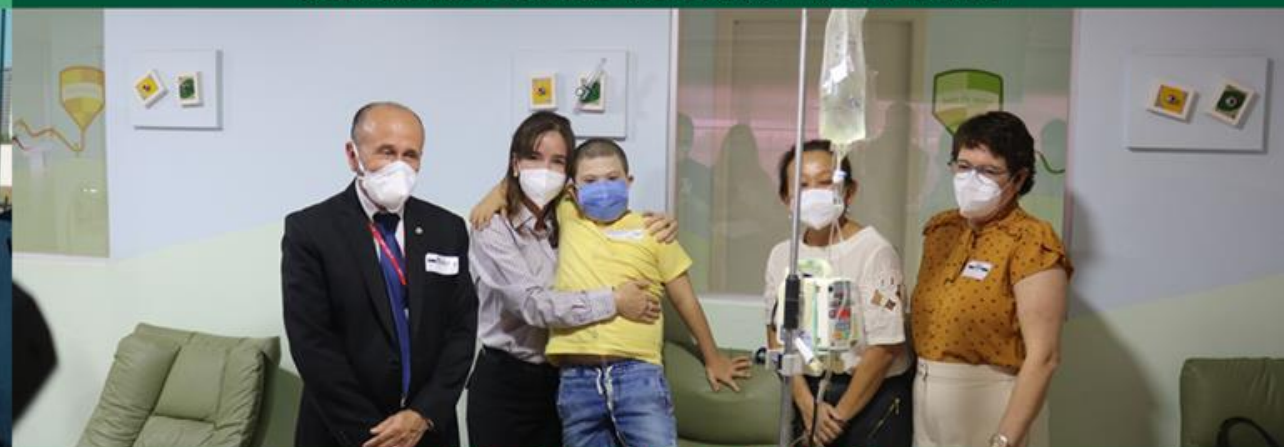
Ministério Público de Goiás