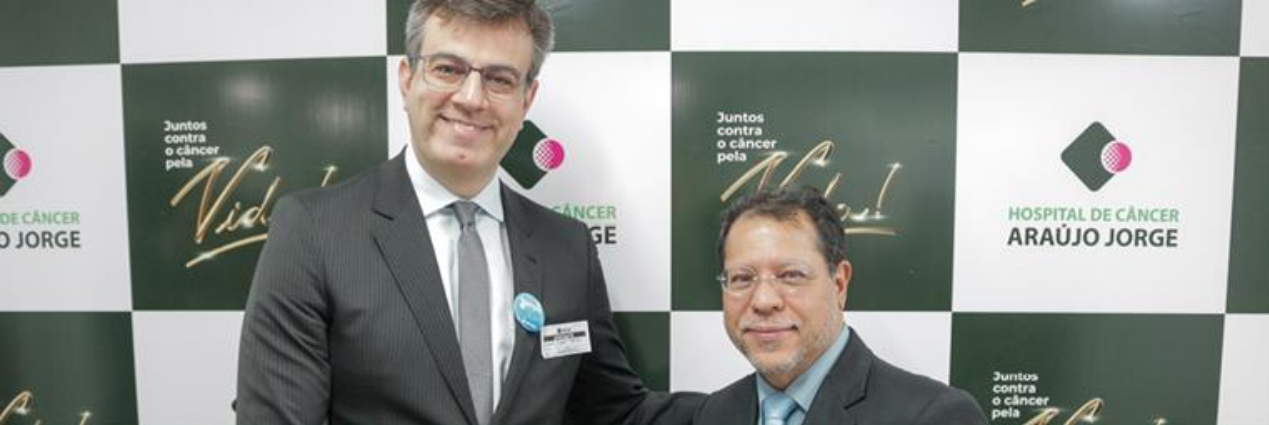
Procurador-geral de Justiça Cyro Terra Peres