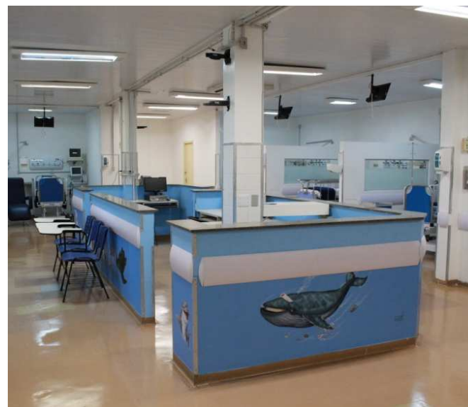
CTI Pediátrico do Hospital da Baleia

Pronto atendimento para pacientes vinculados ao Hospital da Baleia.