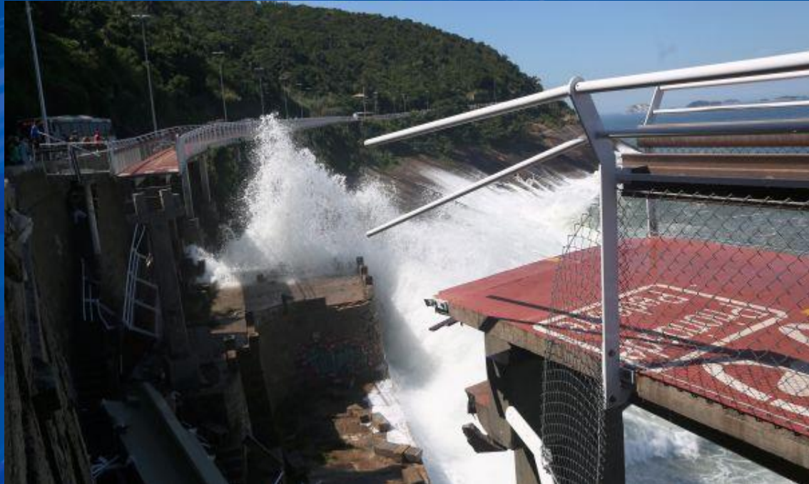
Ciclovía Tim Maia, na Avenida Niemeyer, no Rio de Janeiro