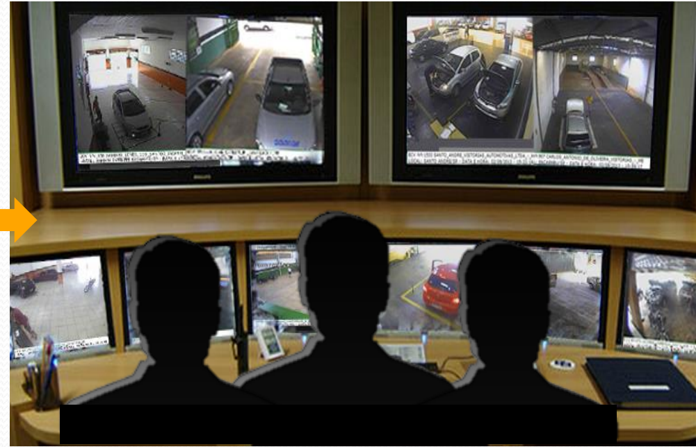
Sala de Monitoramento por Câmeras (tempo real)