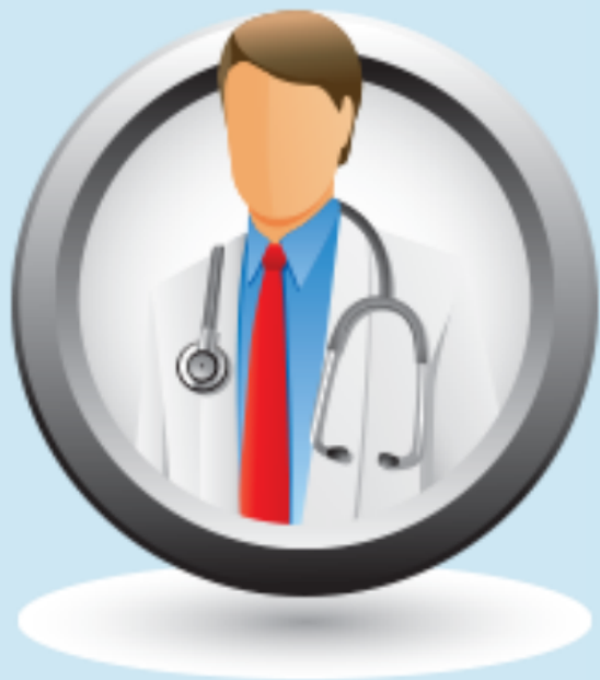
Modelo Brasileiro de Cuidado Integrado ao Idoso