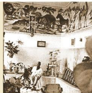
Detalhe mural com bichos na residência de Natal

1940 – O bicho passa a subvencionar desfiles das Escola de Samba. Natal da Portela