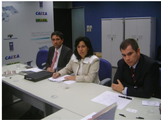
Encontro FNP e OAB