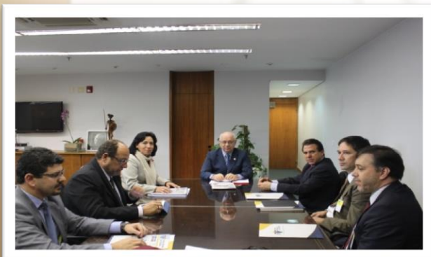
Com Ministro Teori