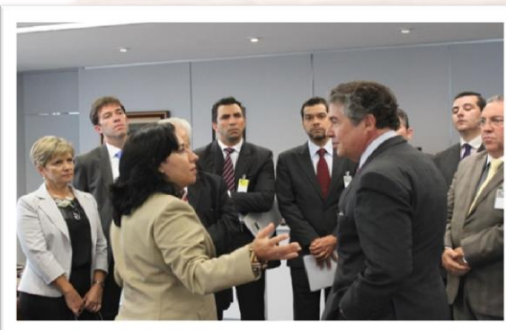
Com Ministro Marco Aurélio