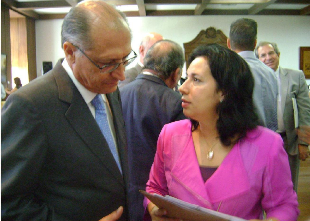
Com Governador Geraldo Alckmin

Em Reunião da APM, pedi ao Governador Geraldo Alckmin que lidere no Estado a luta pela redução dos índices de cobranças dos precatórios