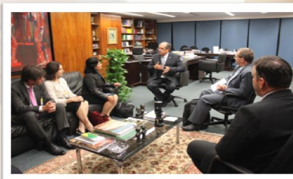
Com Ministro Gilmar Mendes