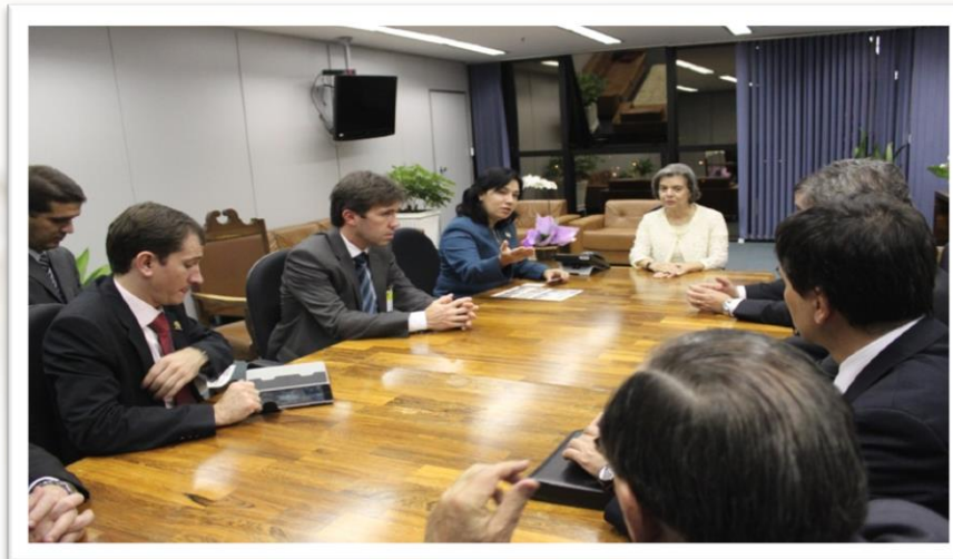
Com Ministra Carmen Lucia

Com os sequestros, a FNP e outras entidades, em companhia de prefeituras de todos os estados foram ao STF sensibilizar os ministros.