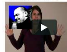
Bandalargar from Pedro Ekman on Vimeo.