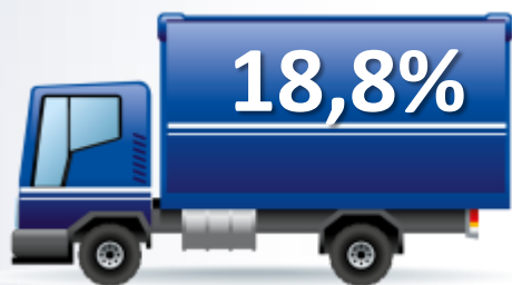
CD Mercadoria Terceirizada