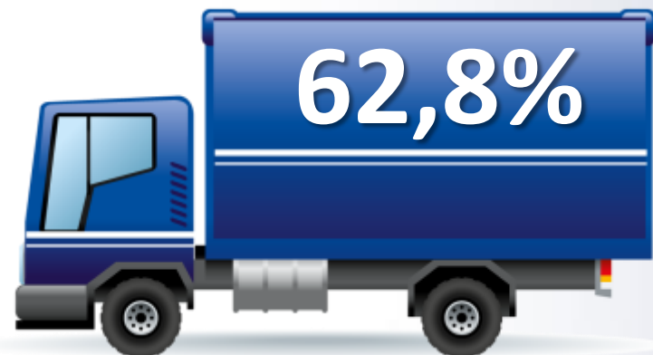
Frota Própria de Caminhão

Fonte: Ranking Abras 2013 - Base : Total 500 empresas Frota Própria de Caminhão: 332 empresas que representam 50% do setor