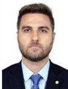
Wladimir Garotinho (PSD/RJ)