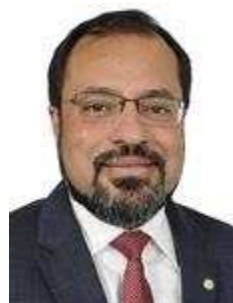
Camilo Capiberibe (PSB/AP)