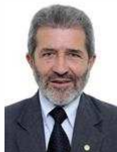
Gonzaga Patriota (PSB/PE)