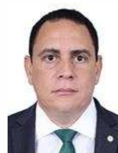
Da Vitoria (CIDADANIA/ES)