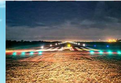
Indicadores e dispositivos de sinalização, de sinalização horizontal e de luzes, conforme aplicável