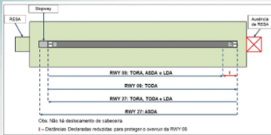
RESA física ou implantação de RESA virtual