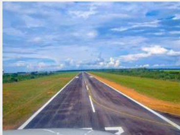
Faixa preparada nivelada, limpa e livre de obstáculos