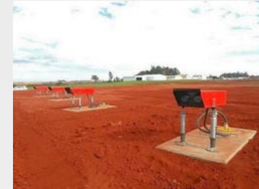
Indicador visual de rampa em uma das cabeceiras