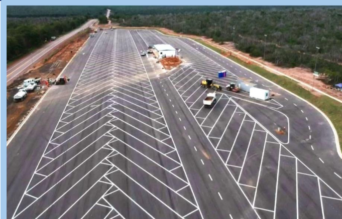
BR -163/PA - Novo Progresso - Via Brasil