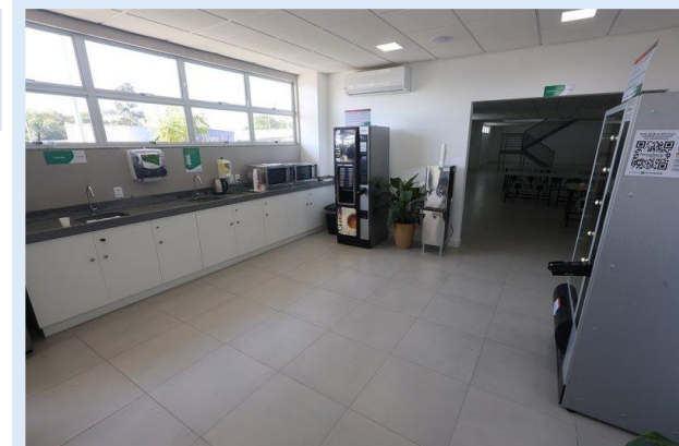
BR-116/MG - Ubaporanga Eco Rio Minas