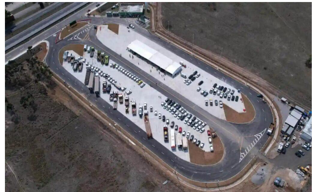
BR-116/RJ - Seropédica - Ecovias Rio Minas