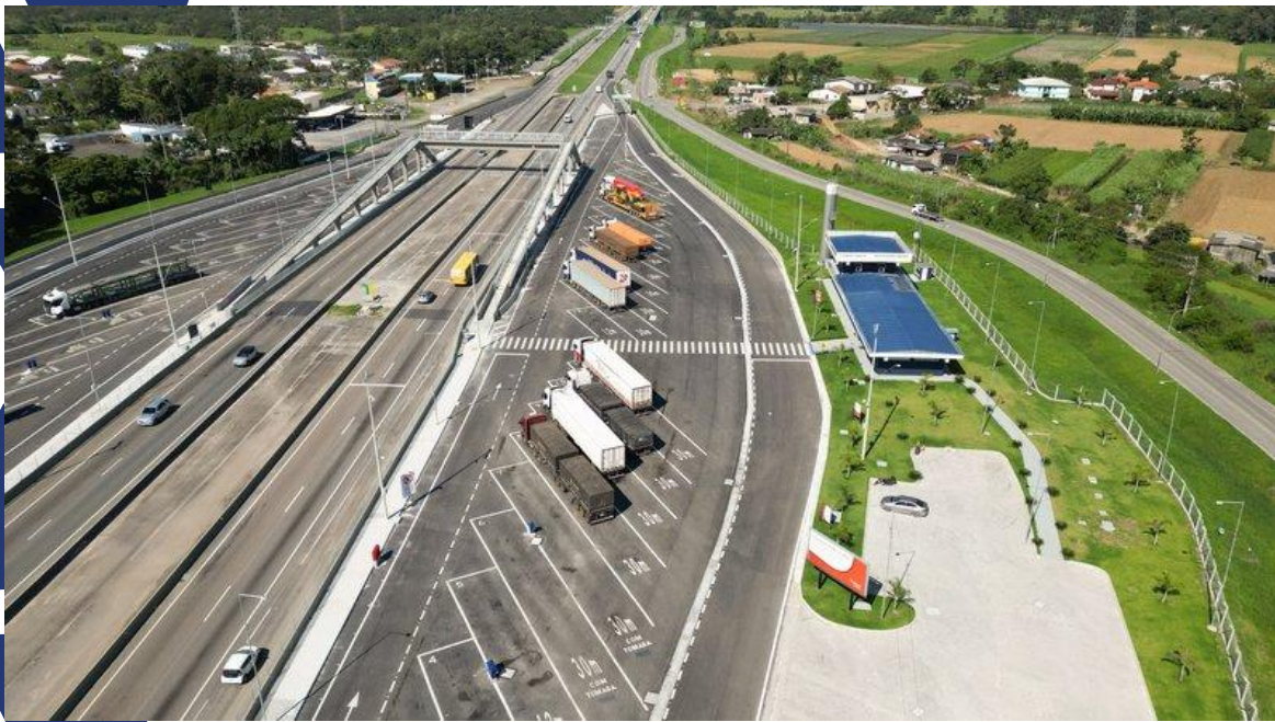
BR-101 - Palhoça - Autopista Litoral Sul

Art. 14. O PPD deve oferecer instalações adequadas e manutenção de seu acesso e pavimento interno recorrentes, com sinalização horizontal e vertical claras e vagas bem demarcadas , de modo a evitar acidentes no pátio de estacionamento ou nas edificações.