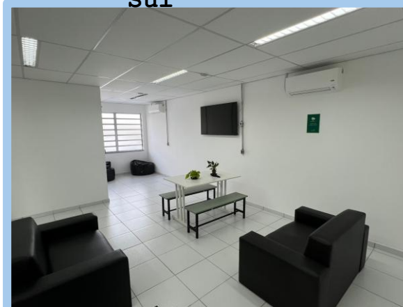
BR 101/SC - Palhoça - Autopista Litoral Sul