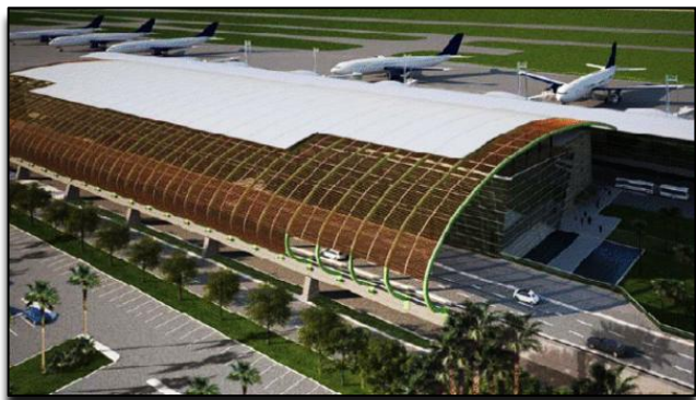
1º aeroporto federal concedido à iniciativa privada