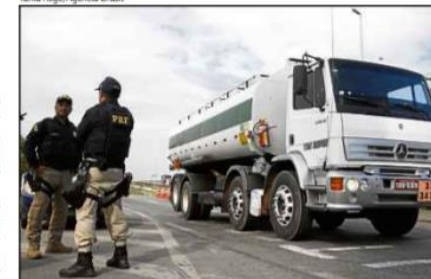
A PRF passará a multar motoristas profissionais sem o exame