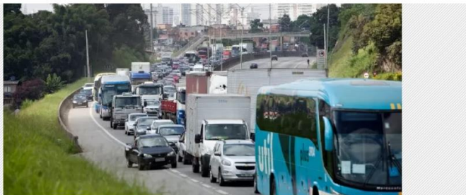
Os caminhões, ônibus e vans que não realizarem exame toxicológico no prazo vão levar multa automática superior a R$

Exame toxicológico: multa começa hoje e cocaína lidera drogas detectadas