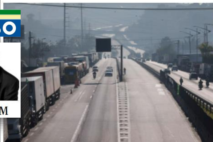
Marcos Alves | Agência O Globo

Por Nelson Lima Neto • 17/08/2021 • 09:00