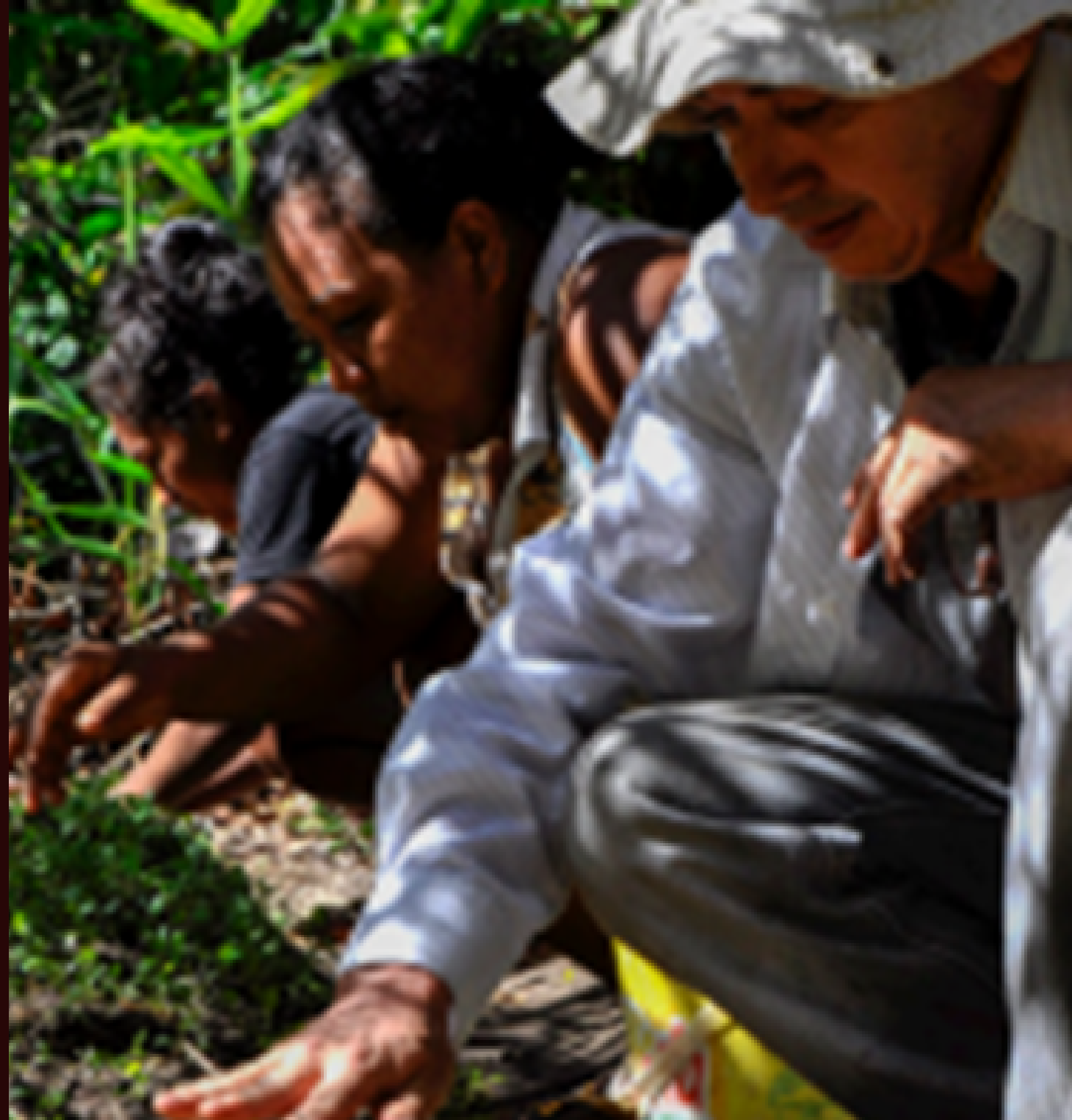
BIOMA AMAZÔNICO TERRA QUILOMBOLA ÁFRICA Município de Moju/PA