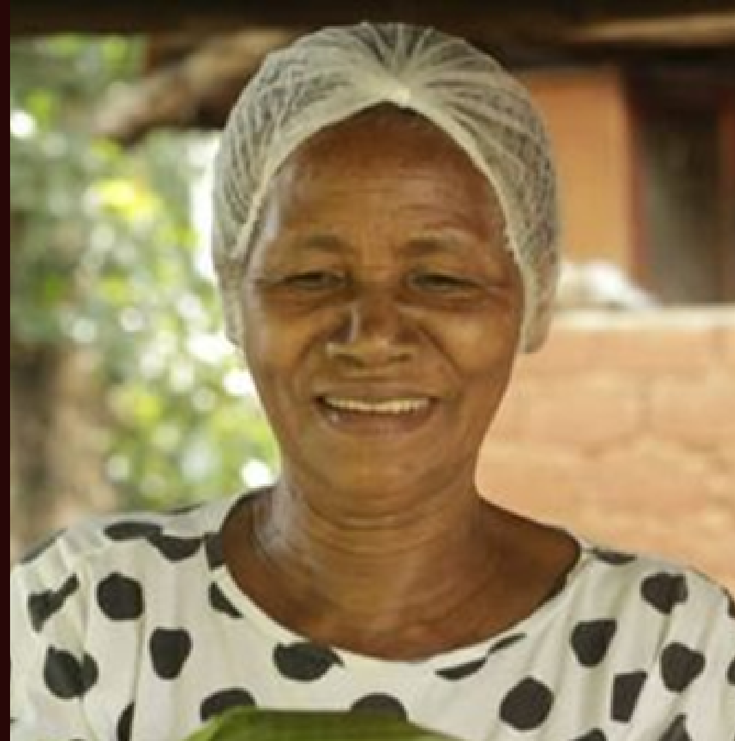
BIOMA CERRADO QUILOMBO POVOADO MOINHO Chapada dos Veadeiros (Alto Paraíso/GO)