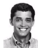
Índio da Costa