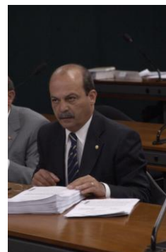
Dep. Roberto Santiago

A Subcomissão da Terceirização promoveu quatro reuniões em 2007, sendo duas de audiências públicas, nas dependências da Câmara dos Deputados, e duas mesas redondas, externas às dependências desta Casa, nas cidades do Rio de Janeiro e de Belo Horizonte, com o objetivo de ouvir os segmentos empresariais e de trabalhadores, tendo em vista colher e analisar sugestões em relação aos projetos de lei que regulamentam a prestação de serviços terceirizados no Brasil, em tramitação na Comissão.