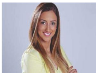
FLÁVIA ARRUDA Secretária Geral

DEPUTADA FEDERAL Partido: DEM Estado: Tocantins