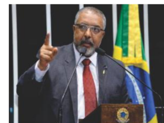
PAULO PAIM 3º Vice Presidente

DEPUTADO FEDERAL Partido: PP Estado: Goiânia