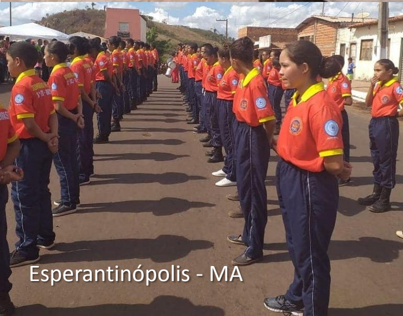
Esperantinópolis - MA