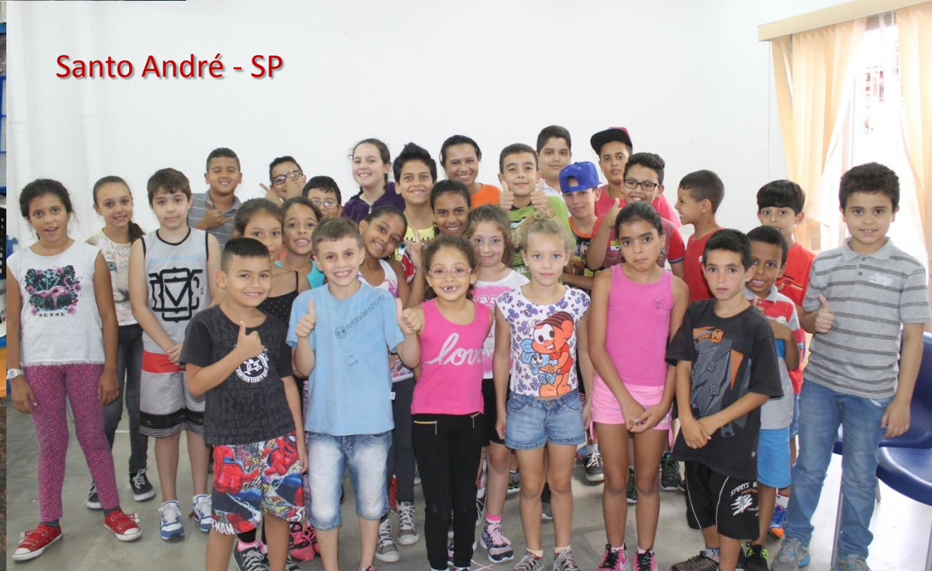
Santo André - SP