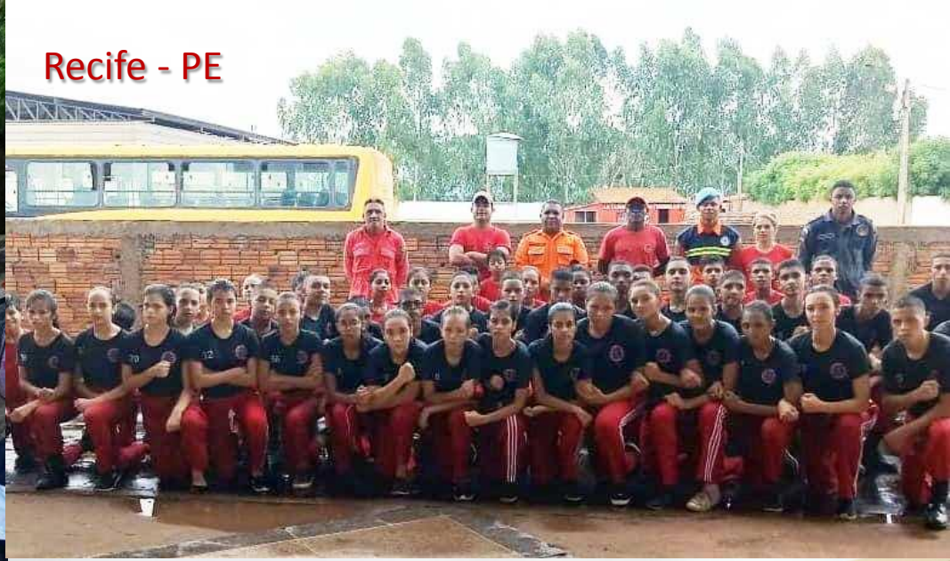
Recife - PE