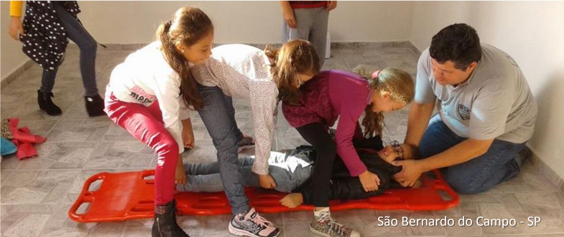
São Bernardo do Campo - SP