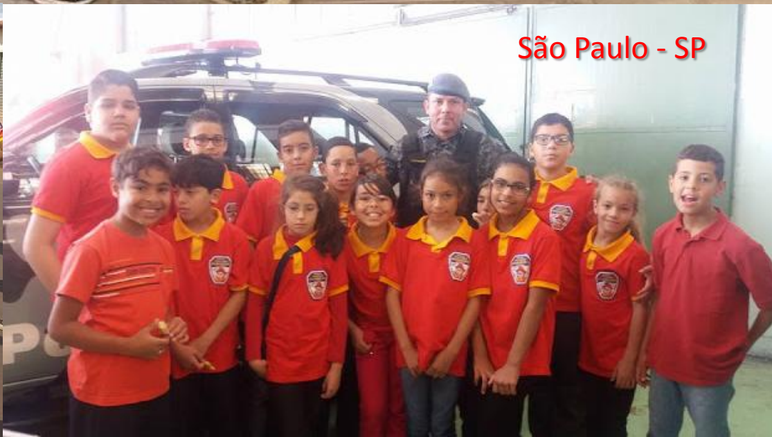
São Paulo - SP