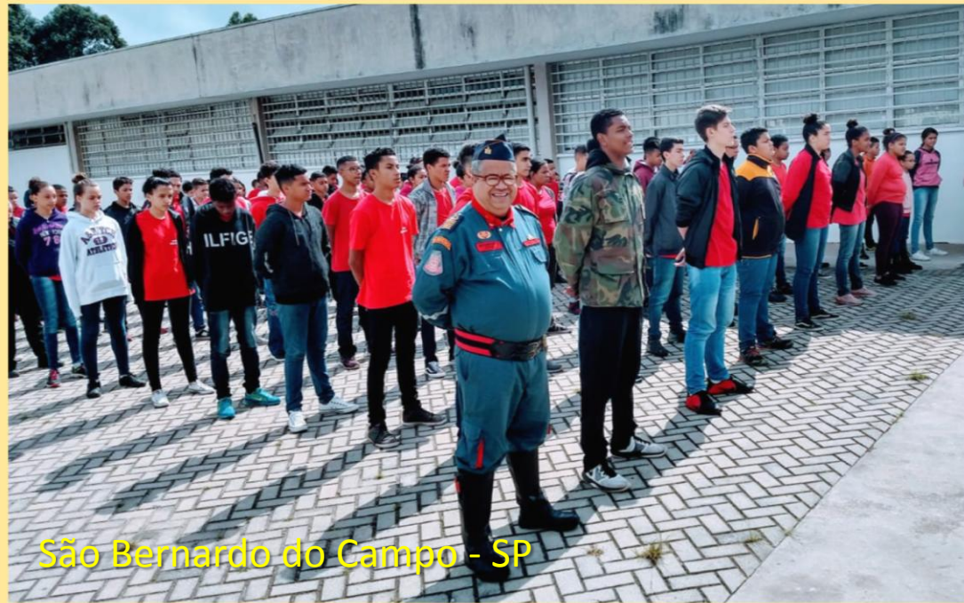
São Bernardo do Campo - SP

O Profissional Bombeiros Civil, também pode contribuir com centenas de escolas por todo o Brasil levando moral, cidadania e atitudes de prevenção a serem repassados esses jovens.