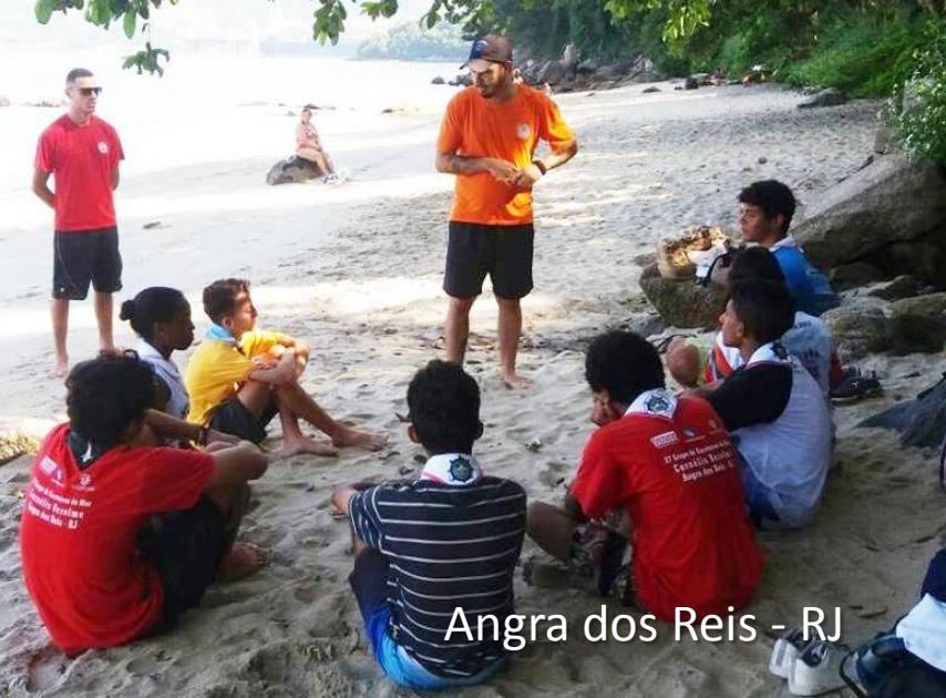
Angra dos Reis - RJ