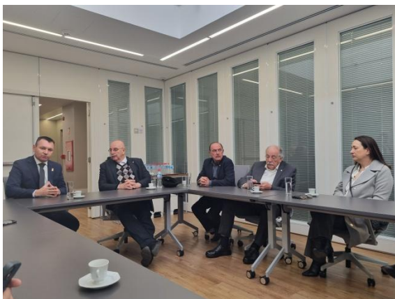
Assessoria da Comissão de Saúde