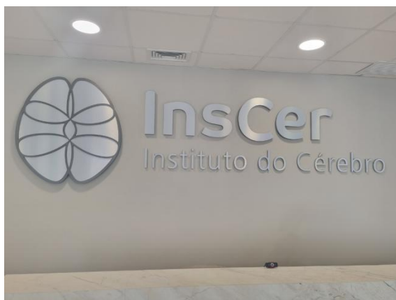
Assessoria da Comissão de Saúde