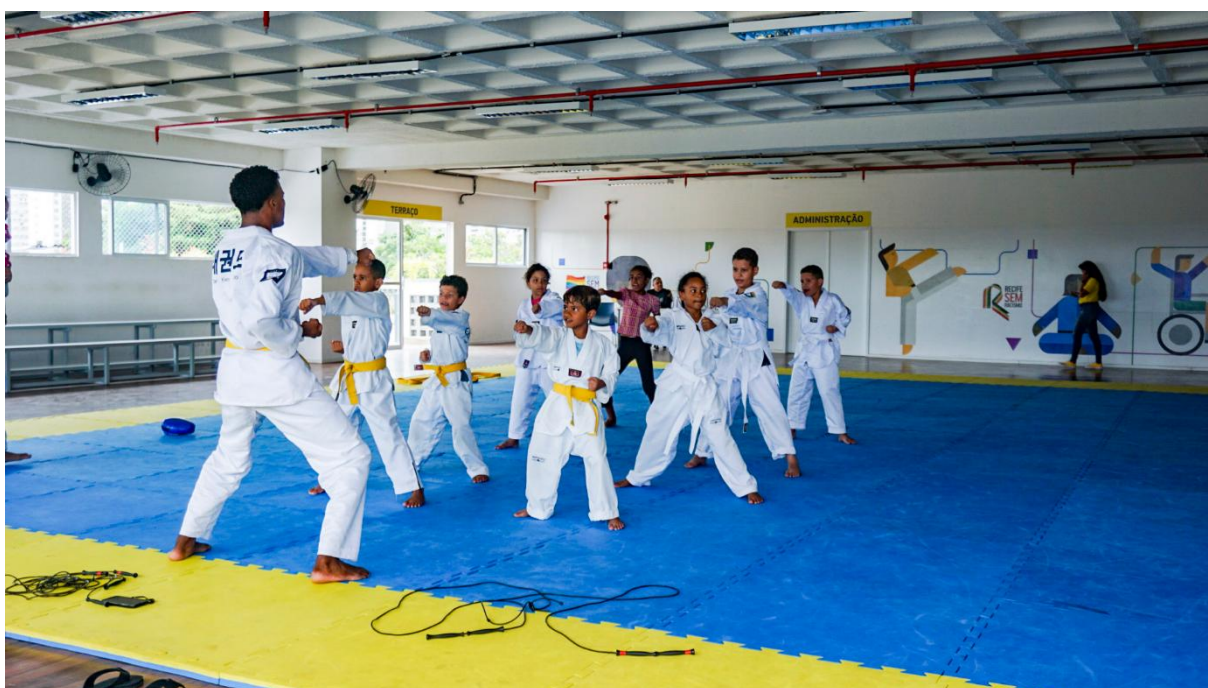
Dojô, local de aprendizado e prática de judô.