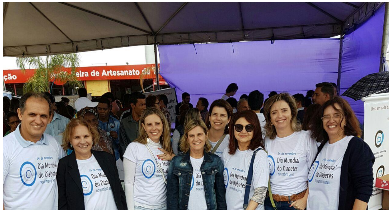
Dia Mundial do Diabetes