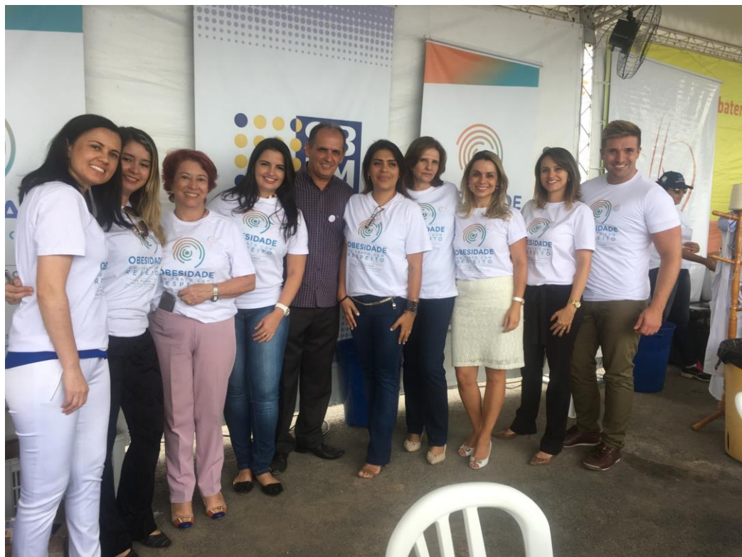
Dia de Combate à Obesidade