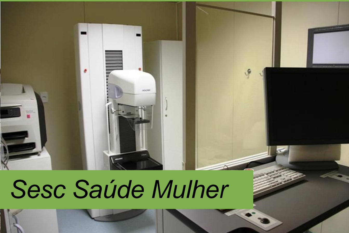
Sesc Saúde Mulher