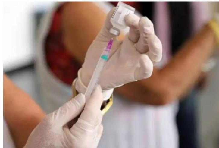
Vacina: imunizante contra pentavalente ficará em falta até novembro

Brasília — O fornecimento da vacina pentavalente, que protege contra difteria, tétano, coqueluche, hepatite B e hemófilo B, será interrompido nos postos públicos de saúde até novembro. A falta do imunizante, que já é sentida em vários postos do Sistema Único de Saúde , deverá se agravar até o fim do ano, em