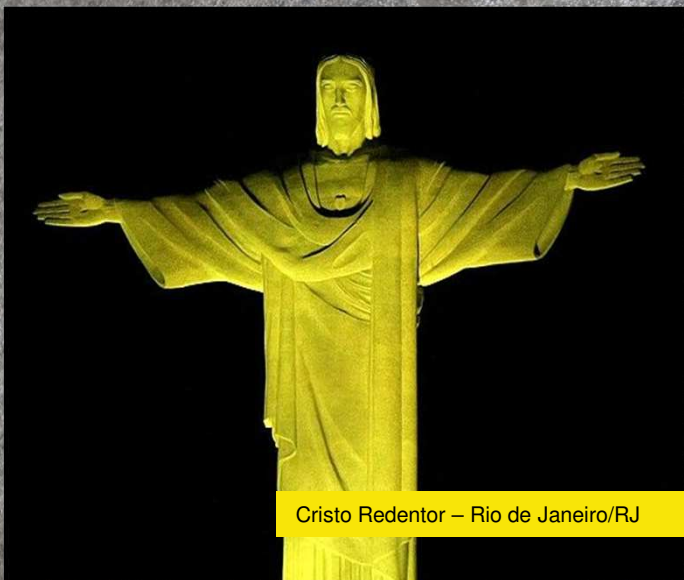
Cristo Redentor – Rio de Janeiro/RJ