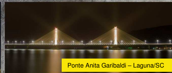
Ponte Anita Garibaldi – Laguna/SC