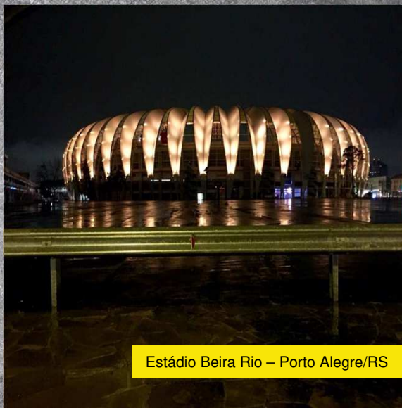
Estádio Beira Rio – Porto Alegre/RS