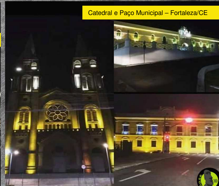
Catedral e Paço Municipal – Fortaleza/CE