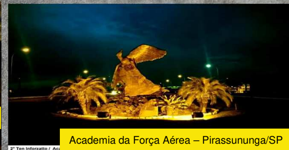
Academia da Força Aérea – Pirassununga/SP