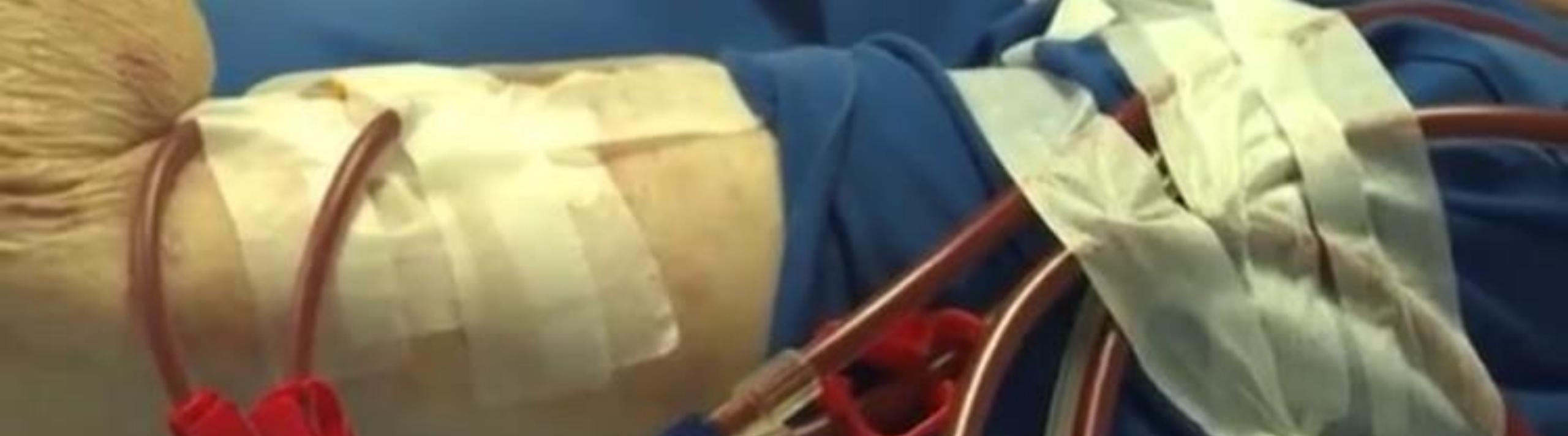
TABELA SUS PARA HEMODIÁLISE = DEFASAGEM HISTÓRICA

Valor atual repassado pelo Ministério da Saúde por sessão: R$ 194,20