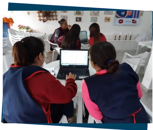
Oficina de sublimação