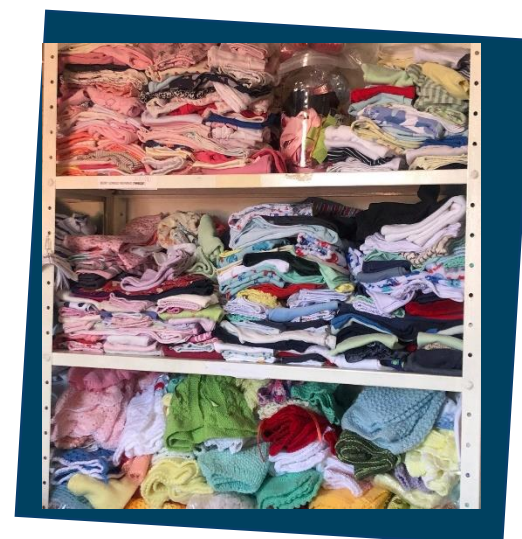
Oficina de Enxoval