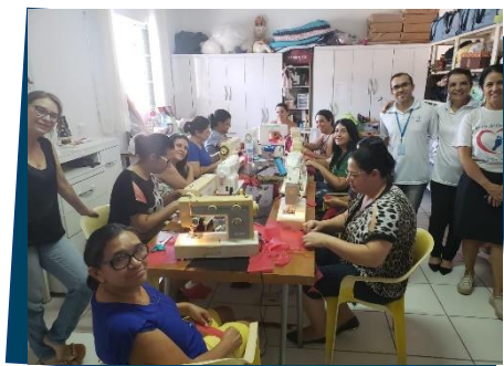
Oficina de Corte e costura