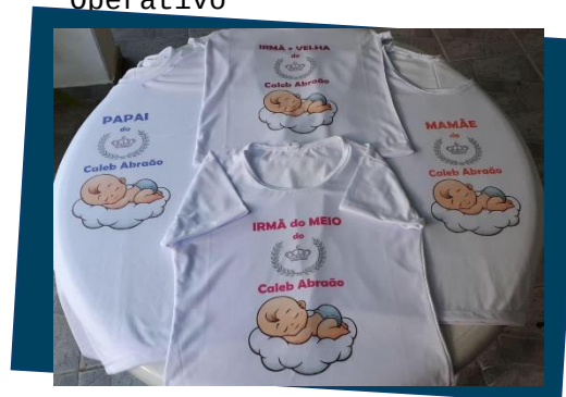
Oficina de Geração de renda.