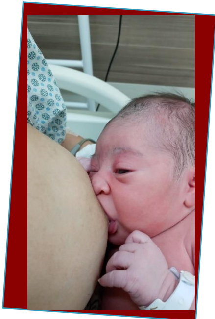
Autorização de imagem cedida pela família

Fundada em 2013 por 12 (doze) membros da sociedade civil, que se propuseram a contribuir de forma efetiva na defesa da vida.