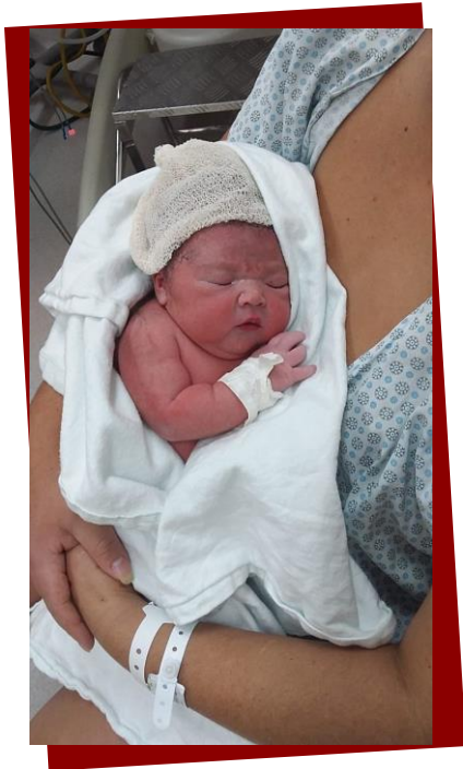
Autorização de imagem cedida pela família

É importante destacar que o apoio ofertado para mulheres em vulnerabilidade e fragilidade emocional por conta de uma gravidez indesejada é uma ferramenta de