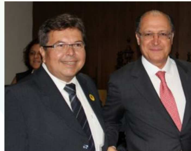
Governador Geraldo Alckmin criou 1.853 novos cargos para o Estado de São Paulo

Os concursos públicos serão abertos para reforçar o efetivo do Instituto de Criminalística (IC) e do Instituto Médico-Legal (IML), subordinados à SPTC