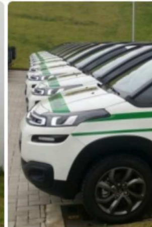
Ao todo foram distribuídos 26 Citroën Air Cross em todo Estado