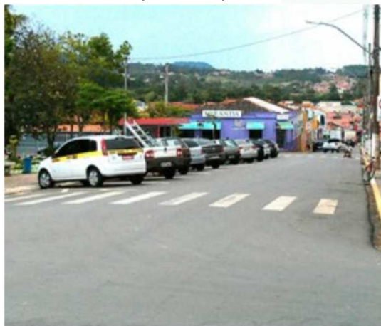
Falta perito na Polícia Civil de Guareí

Segundo a polícia de Guareí, SP, há um perito para atender 13 municípios.