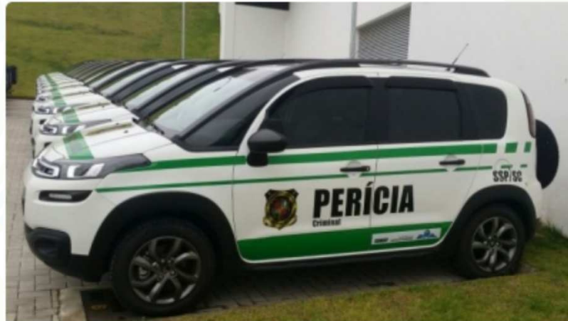
Ao todo foram distribuídos 26 Citroën Air Cross em todo Estado