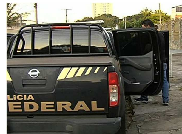
Polícia Federal cumpre mandados em Goiânia nesta quarta-feira

Do G1 GO, com informações da TV Anhanguera