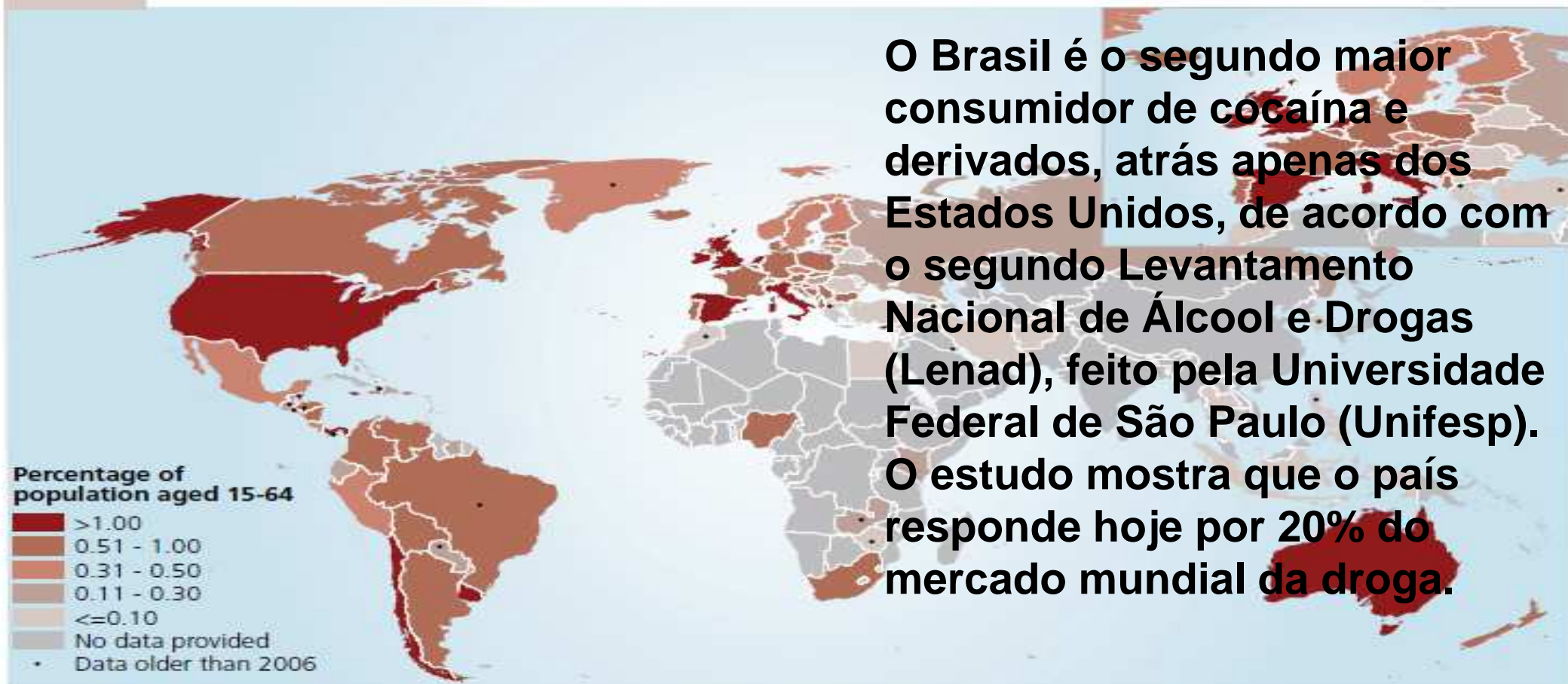
Map 5. Prevalence of cocaine use in 2010 (or latest year)