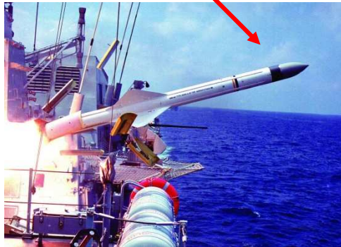
Radar Auto-Diretor (Míssil MAN-SUP)