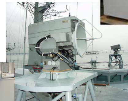
Guerra Eletrônica MAGE e CME