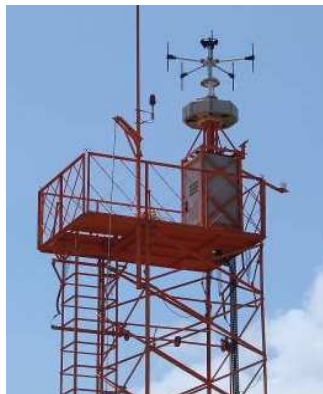
Sistema de Monitoração do Espectro Eletromagnético (400 MHz – 40 GHz)