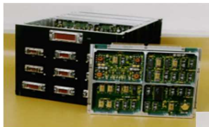
Computador de Controle de Telemetria e Telecomando