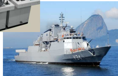
Sistema de Controle da Máquina do Leme (Corveta Barroso)