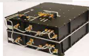
Transmissor de Imagens Digitalizadas em Banda X