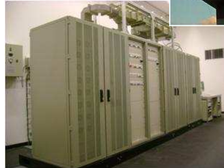
Radar Vigilância do Espaço Aéreo