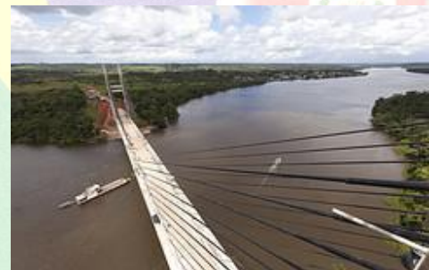
Ponte Brasil-Guiana Francesa